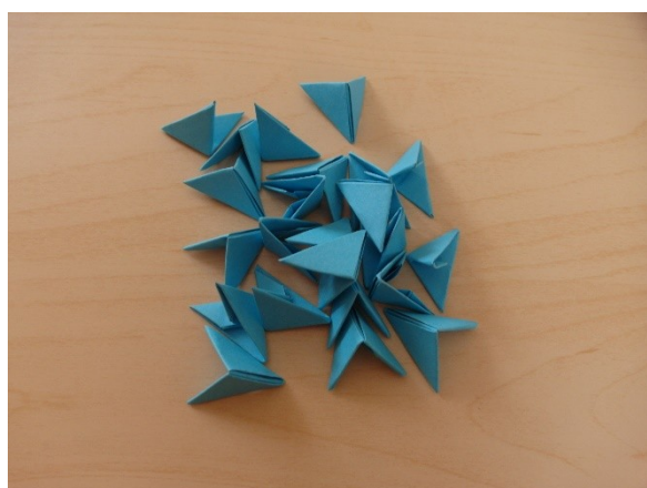
4. Poskládání dílků