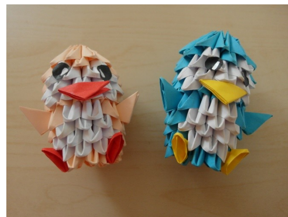
7. Poskládání dalšího kamaráda