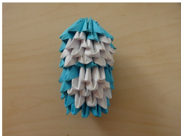
5. Dodělání hlavičky