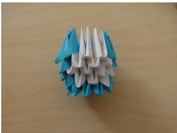
6. Poskládání tělíčka tučňáka