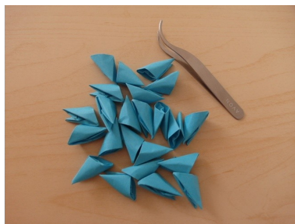
3. Otevření kapsiček pomocí pinzety