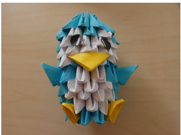
8. Přilepení zobáku a očí, vložení rukou a nohou