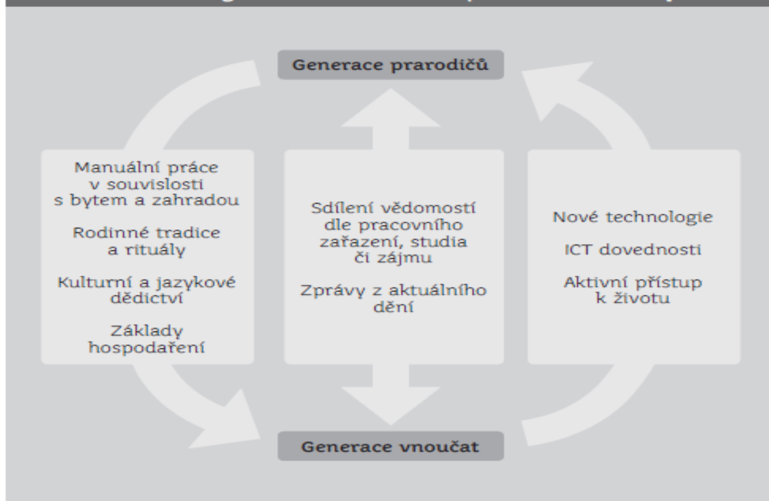
Obr. 1: Schéma mezigeneračního učení mezi prarodiči a vnoučaty