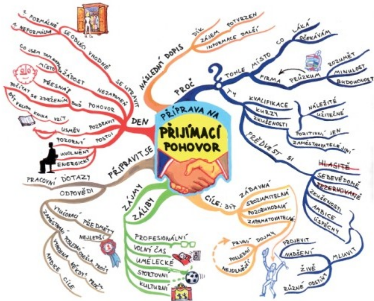
Obr. - Příklad mentální mapy přijímacího pohovoru