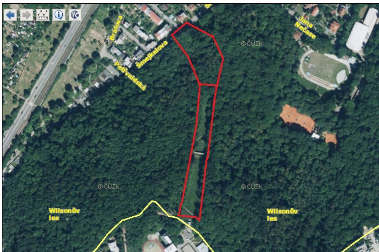
Obr. 1: Ukázka nedokonale zpracovaného mapového výstupu z případové studie.