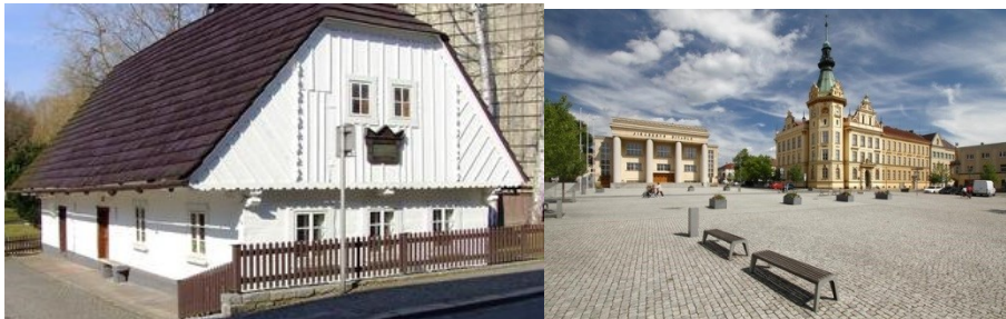
rodný domek A. Jirásků a náměstí v Hronově s divadlem Aloise Jirásků

1955 – 1957 byl domek zrekonstruován, je v něm malá expozice, připomínající spisovatele. Původně k domku přiléhaly i hospodářské objekty (chlév, za ním konírna a stodola).