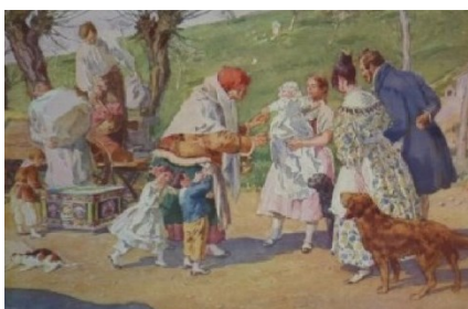
ilustrace A. Kašpara – babiččin příjezd

Cesta nás pak povede dál kolem mlýna a dalších míst známých z knihy Boženy Němcové (naučná stezka) až k ratibořickému zámku.