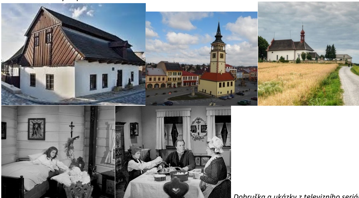
Dobruška a ukázky z televizního seriálu

Z ostatních objektů v Dobrušce stojí za zmínku ještě kostelík sv. Ducha, který si zahrál jako jedna z mála dobrušských památek ve zmíněném seriálu.