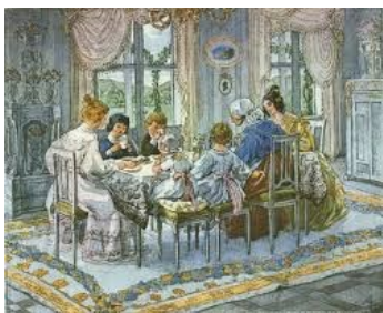
ilustrace A. Kašpara – návštěva u paní kněžny na zámku

„Ta paní je moje babička,“ řekla kněžna. – „Nu pročpak ne; to je pěkná paní,“ odpověděla babička. „Vpravo to je děd, vlevo otec,“ dále ukazovala kněžna. – „Čistí lidé, milostivá paní otce nezapře. A kde je panímáma?“ – „Tamto je moje matka i sestra,“ řekla kněžna, ukazujíc dvě podobizny nad psacím stolem. – „Pěkné to paní, radost se na ně dívat,“ mínila babička; „ale sestřička není podobna ani otci ani matce; to už někdy bývá, že se děti zvrhnou po někom z kolikátého kolena. Ale ten mladý pán tuhle je mi povědom, nemohu se ale zpatovat odkud.“ – „To je ruský císař Alexander,“ rychle odpověděla kněžna, „toho tys neznala.“ – „Ano, jakpak bych neznala, stála jsem od něho asi dvacet kroků. To byl krásný člověk, jenže tuto je mladší, ale přece jsem ho poznala. Ten a Josef císař, to bylo pár čistých lidí.“ – kněžna ukázala na protější zeď, kde visel obraz, poprsí to v životní velikosti. „Josef císař!“ spráskla ruce babička, „jako by mu z oka vypadl. Vidíme, jak je tu máte hezky pohromadě. To jsem si nemyslila, že uvidím dnes Josefa císaře. Pánbůh mu dej věčnou slávu, to byl hodný pán, zvláště na chudý lid. Tuten tolar dal mi svou vlastní rukou,“ řekla babička povytáhnouc ze západní tolar. Paní kněžně zalíbila se babiččina prostosrdečnost a trefné nápady, i požádal ji, aby vypravovala, která a kde ji císař tím penízem obdaroval.