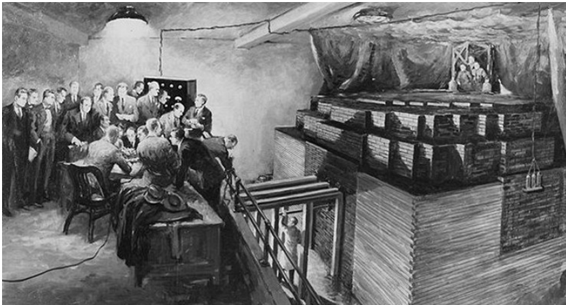
Atmosféra historického okamžiku v Chacagu. Muži vzadu nad reaktorem drží kanystry s roztokem kadmia pro případ nouzového odstavení reaktoru. |

2.12. 1942 Enrico Fermi - první řízená štěpná řetězová reakce s vojenským cílem