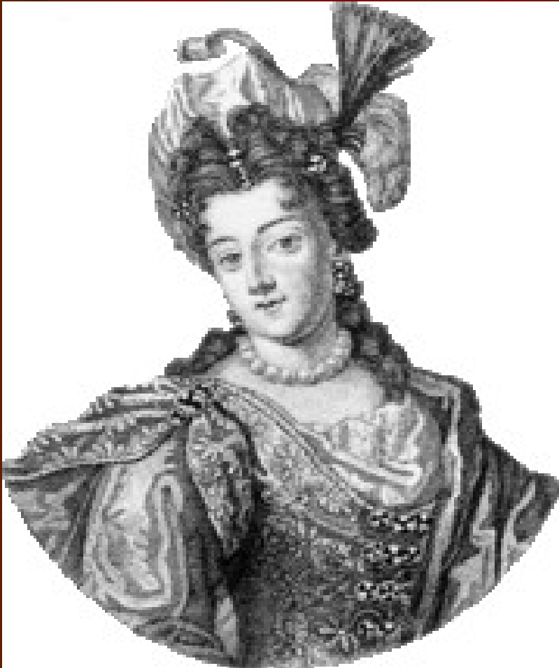
Madeleine de Scudéry , célèbre Précieuse.

La société des salons est née en Europe au, XVIIème bien que l'expression, à cette époque, ne soit pas parfaitement intégré dans les langages. La vie de coeurs est devenue si grossière, que les courtisans épris de politesse et conversation galante prennent l'habitude de se réunir dans quelques hôtels aristocratiques.