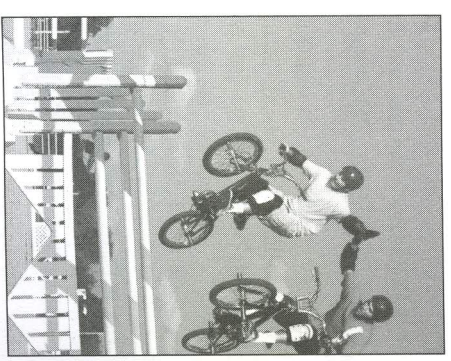
Один из альтернативных видов спорта

К счастью или к сожалению, альтернативные виды спорта никогда не будут включены в программу Олимпийских игр или других официальных соревнований и навсегда останутся только забавными развлечениями.