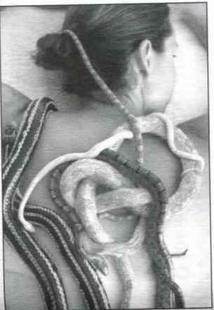
Рептилотерапия – массаж змеями

Рептилотерапия, или массаж змеями, – это, несомненно, один из самых необычных методов массажа. Однако в последнее время желающих испытать на себе эту экзотическую процедуру становится всё больше и больше. Сеанс проходит следующим образом: клиент лежит на спине, а змеи (обычно 6) кладутся на спину человека в виде спутанного коврика. Естественно, в ходе процедуры змеи распухают и расслабляются в разные стороны, но массажист возвращает их на место, запуская в очередную раз. Тяжёлые участки используются для глубокого массажа, а лёгкие змейки, которые, передвигаясь по человеческому телу, вызывают прилив крови к определённым участкам, используются для создания гармоничного массажа.