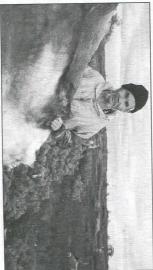
Представитель одного из малочисленных северных народов России

В прошлом большинство народов Севера и Дальнего Востока являлись приверженцами шаманизма. В 16-начале 19 вв. они были обращены в православие. Тем не менее, шаманизм, будучи традиционной формой религии, всё же сохранился. Правда, нынешние шаманы обходятся без бубона и без особого костюма, хотя на время совершения обряда по-прежнему надевают подвески и амулеты.