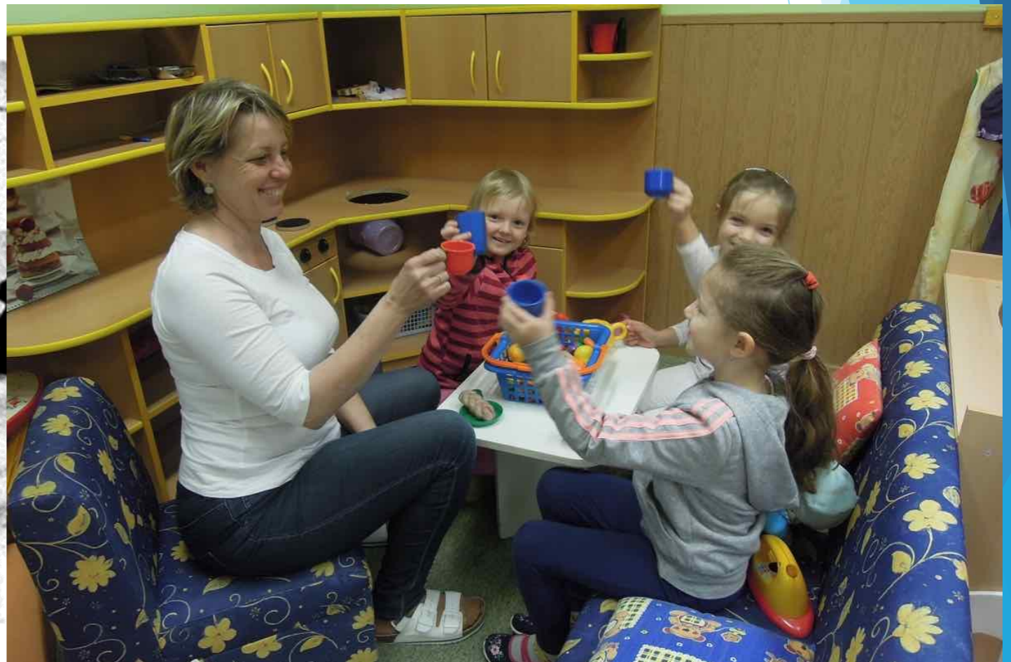
(Opravilová & Uhlířová, 2017) MŠ Bubny