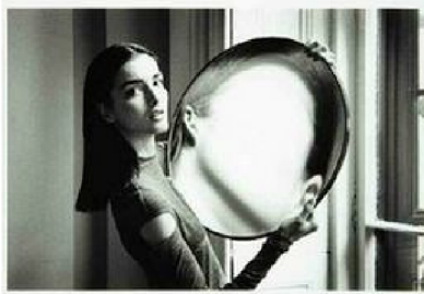
Duane Michals, Magic mirror of uncertainty