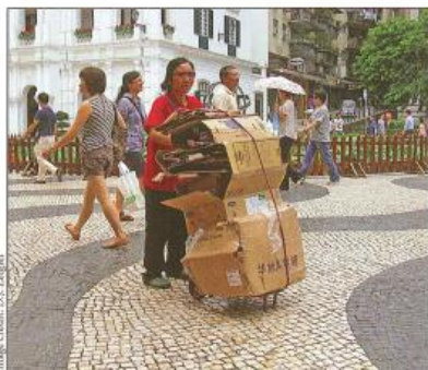
A cardboard scavenger in Macau, one of China's Special Economic Zones, works as a gatherer collecting boxes to re-sell or recycle.

National Geography Standards, Second Edition