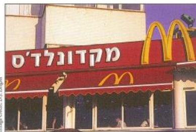
This McDonald's restaurant in Tel Aviv, Israel is an example of a US-based business that has expanded internationally.