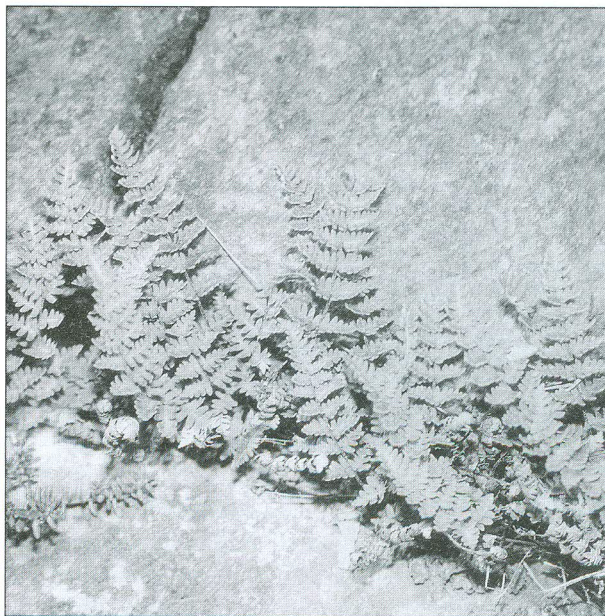
Obr. 101 S kapradinou podmrvkou hadcovou ( Notholaena marantae ) se u nás můžeme setkat pouze na hadcových skalách u Mohelna

vápencových a dolomitových skalách, skalnice kýlnatá ( Helicigona lapicida ) a pavouk pokoutník stájový ( Tegenaria ferruginea ) na skalách a kamenitých místech různého původu.