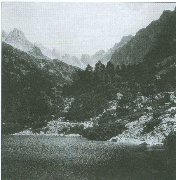
Obr. 103 Alpínský vegetační stupeň není v souvislé podobě v České republice vytvořen; nejbliže je zastoupen v Karpatech a Alpách; okolí Popradského plesa ve Vysokých Tatrách

Dubový stupeň odpovídá zhruba kukuřičnému výrobnímu typu, bukodubový a dubobukový řepařskému, bukový a částečně jedlobukový typu bramborářskému a zbývající stupně typu horského hospodaření.