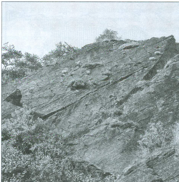
Obr. 100 Hadcový podklad poskytuje zcela specifické podmínky přítomným druhům rostlin a živočichů; Hadcová step u Mohelna

písečný ( Hipparchia statilinus ), píďalka písečná ( Aplocera efformata ) a pavouk slíďák Alopecosa cursor .