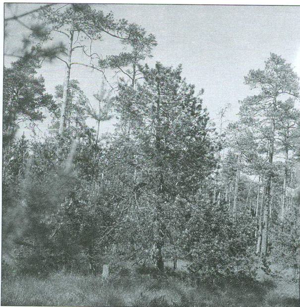
Obr. 102 Rašeliniště připomíná fyziognomicky severskou tajgu a také se zde vyskytují druhy tohoto zonobiomu; Velké Dářko

podmínkách, ale také vertikálně pod vlivem mezo- a mikroklimatu. V rámci každého zonobiomu tak podle orografie území může docházet ke vzniku odlišných společenstev s rostoucí nadmořskou výškou zvaných orobiomy . Rozdílnost orobiomů v různých nadmořských výškách se projevuje jako stupňovitost vegetace . Vegetační stupňovitost je zvláště nápadná ve vysokých pohořích, kde je možno pozorovat postupný sled zcela odlišných biocenóz od úpatí po nejvyšší vrcholy. Výše položené orobiomy někdy svým charakterem do určité míry připomínají severněji položené zonobiomy, např. horská smrčina se druhovým složením blíží ekosystému severské tajgy.