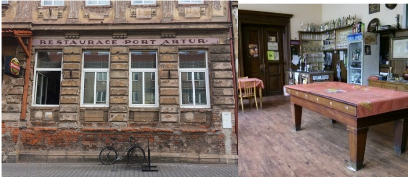
restaurace – bar Port Artur