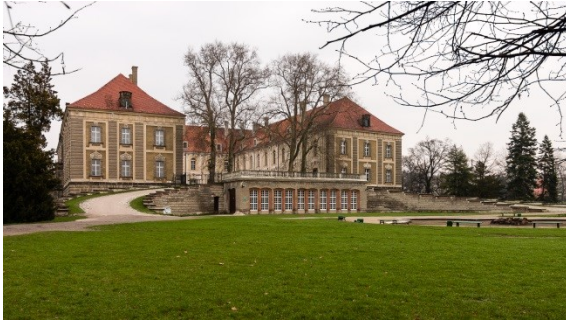
vévodský zámek ve slezském městě Záháj