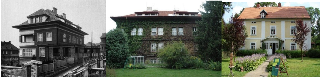
vila bratří Čapků na Královských Vinohradech v Praze a Čapkova letní usedlost Strž