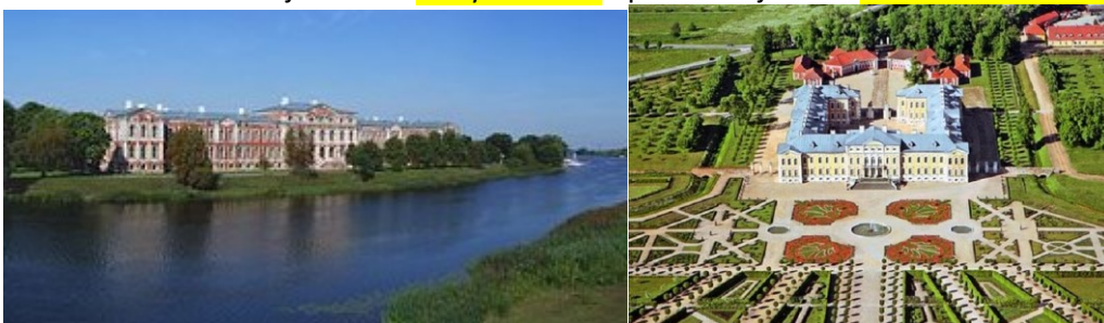
vévodský palác v Mitavě (nyní Jelgava) a letní vévodské sídlo Würzau (nyní Rundals pils)