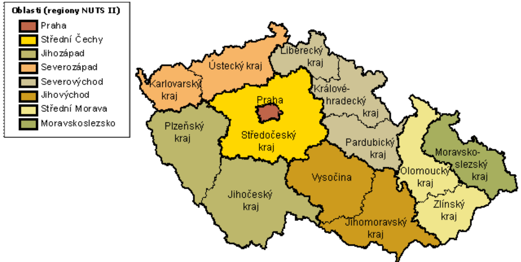
Mapka regionů NUTS II a NUTS III (krajů)