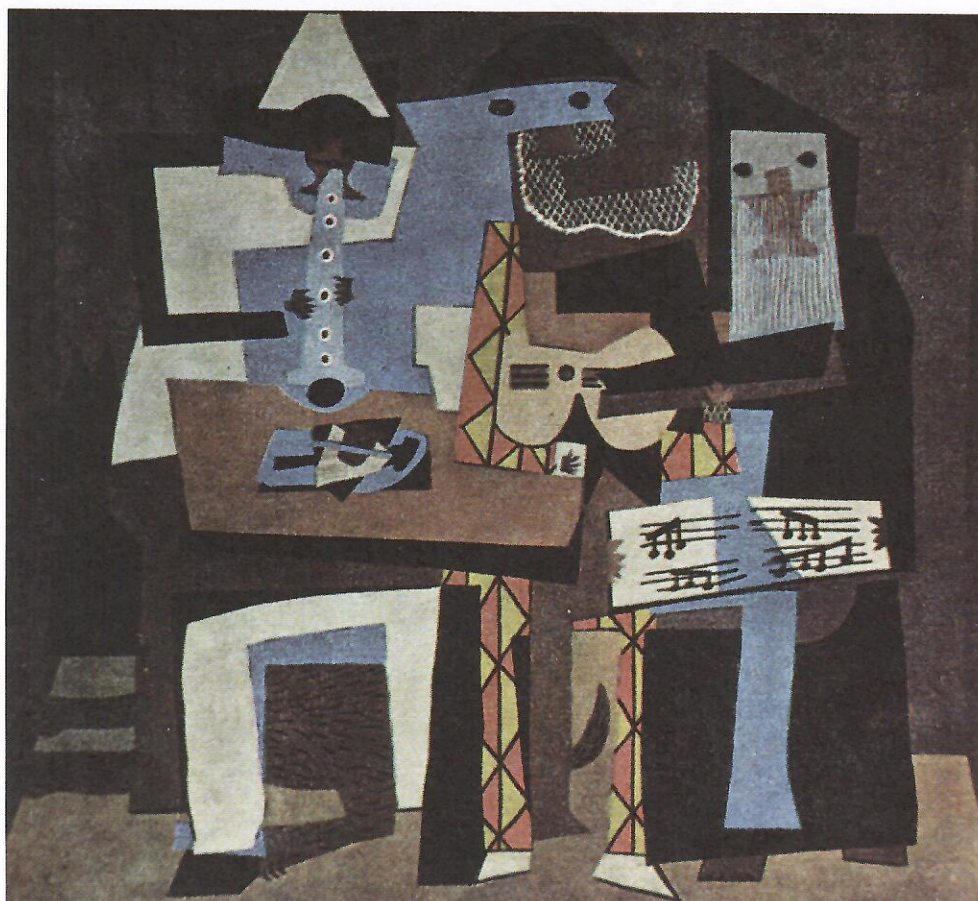
Pablo PICASSO (1881–1973): TŘI HUDEBNÍCI (1921)

ZMATENÍ JAZYKŮ (hudebních, samozřejmě) ANEB ZAVRHUJEME A HLEDÁME Čas se krátí, zahušťuje, každý tvůrce chce být jiný, chce být nový.