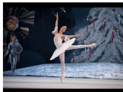
P. I. Čajkovskij: Louskáček – Tanec cukrové víly