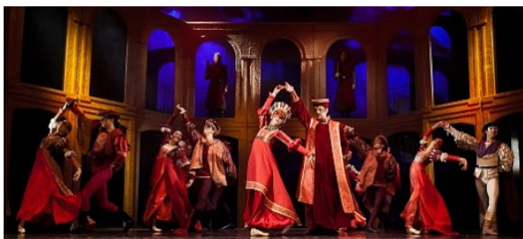
Sergej Prokofjev: Romeo a Julie – Tanec Monteků a Kapuletů