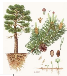
Borovice Ti Ti Ti Ti