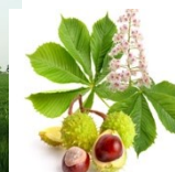
Jírovec Ta Ti Ti