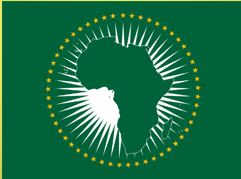
Obr. 1: Logo AU

„Integrované, prosperující a mírové Afriky, poháněné vlastními občany a představující dynamickou sílu v globální měřítku.“