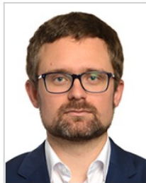
Mikuláš PEKSA skupina Zelených / Evropské svobodné aliance Česko PIRÁTI