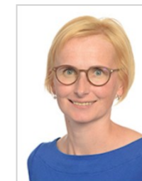
Kateřina KONEČNÁ skupina Evropské sjednocené levice a Severské zelené levice Česko Komunistická strana Čech a Moravy