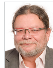
Alexandr VONDRA skupina Evropských konzervativců a reformistů Česko Občanská demokratická strana