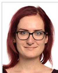
Markéta GREGOROVÁ skupina Zelených / Evropské svobodné aliance Česko PIRÁTI