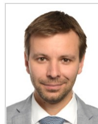
Marcel KOLAJA skupina Zelených / Evropské svobodné aliance Česko PIRÁTI