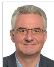
Jan ZAHRADIL skupina Evropských konzervativců a reformistů Česko Občanská demokratická strana