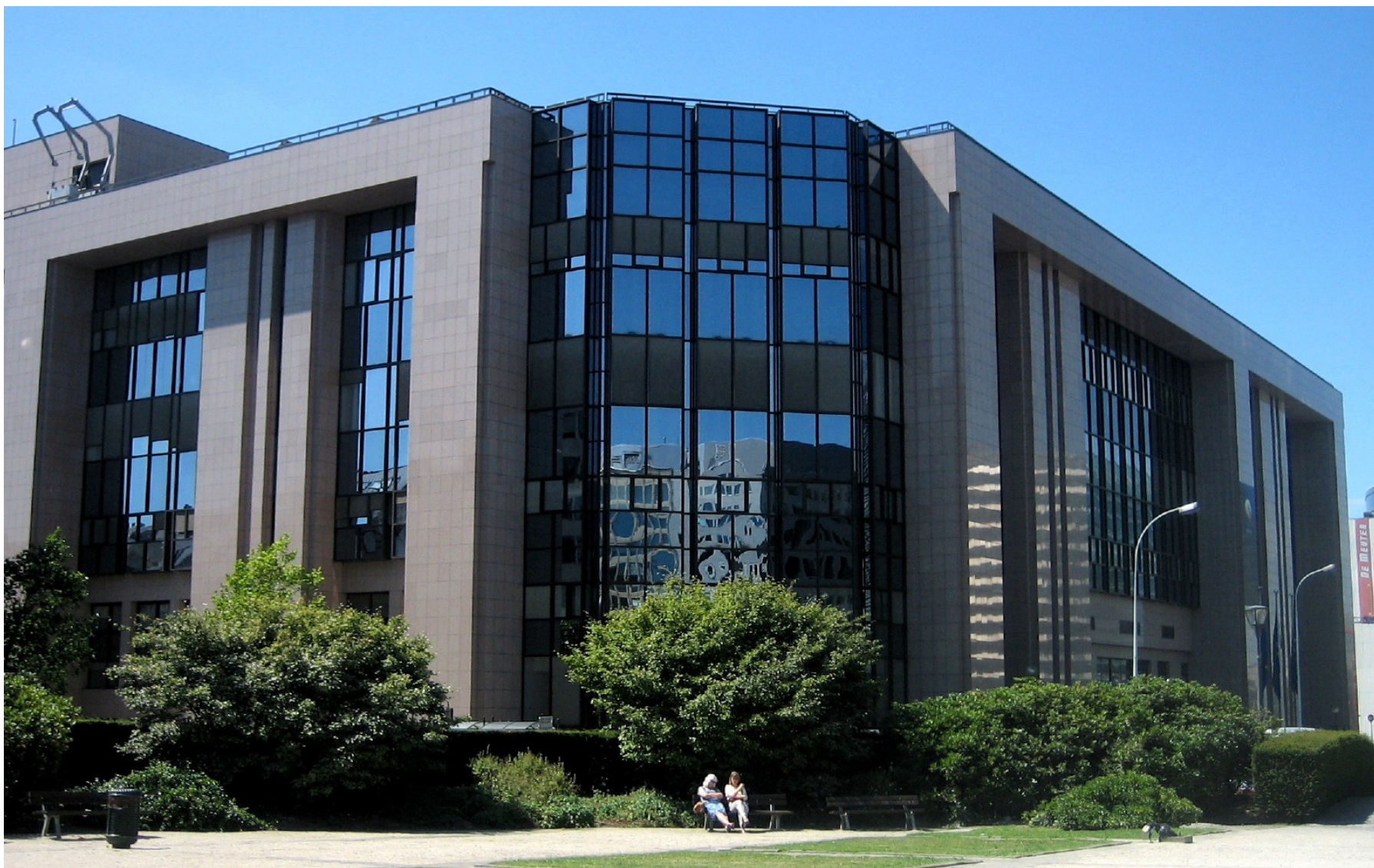
Budova Justus Lipsius, kde se konají zasedání Evropské rady