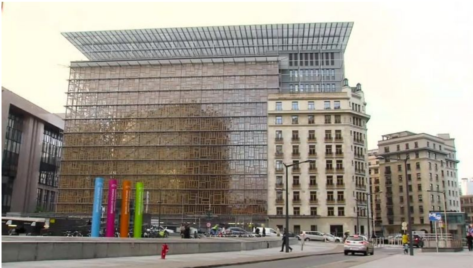
Budova Europa, kde se konají zasedání Evropské rady, Rady EU a dalších subjektů na vysoké úrovni.