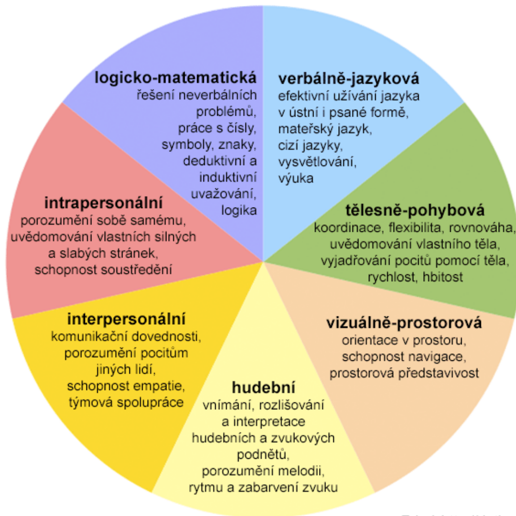
Schéma teorie mnohonásobné inteligence