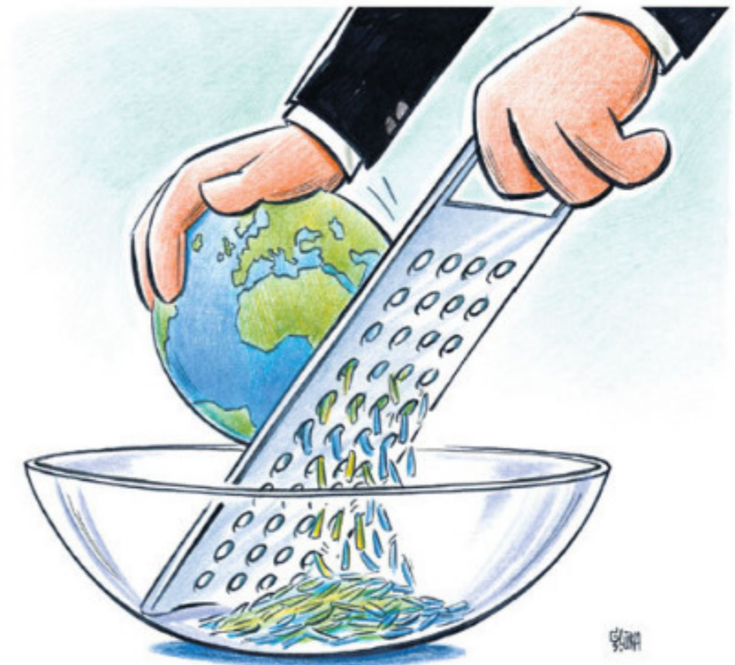
GLOBALIZATION FACING CHALLENGES