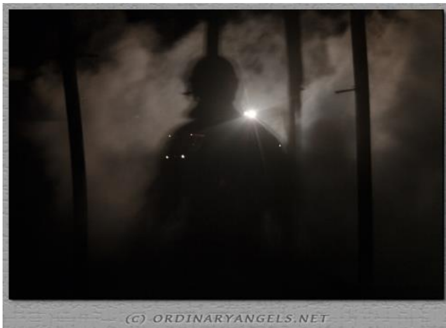
Obr. 2 požár lesa