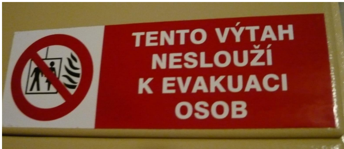
Obr. 3 Informační cedule v panelovém domě