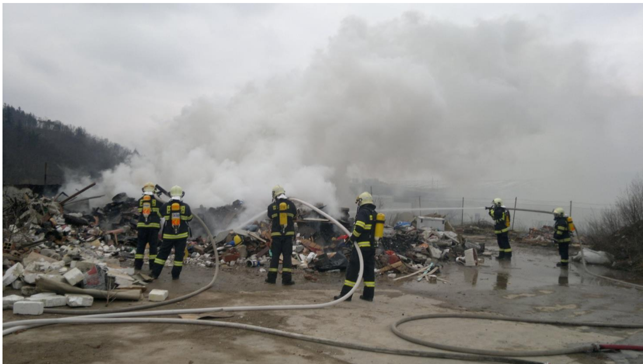
Obr. 1 Požár skládky - JSDH Kuřim