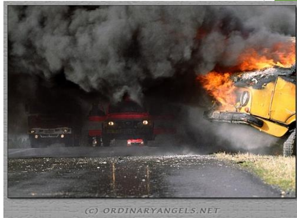
Obr. 9 Dopravní nehoda