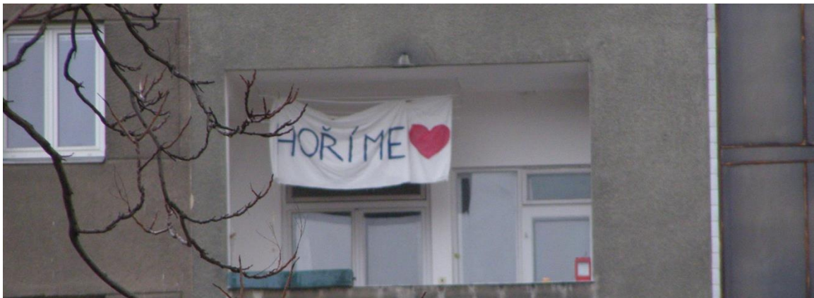
Obr. 4 Balkon nad PS Lidickou