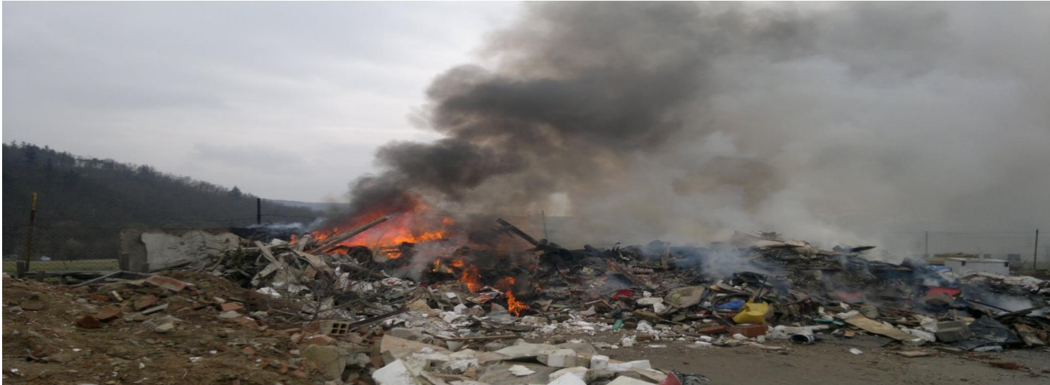
Obr. 7 Hoření skládky – zásah JSDH Kuřim