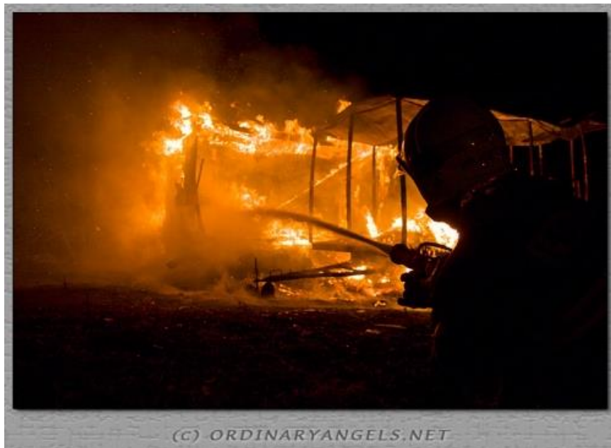
Obr. 8 Požár