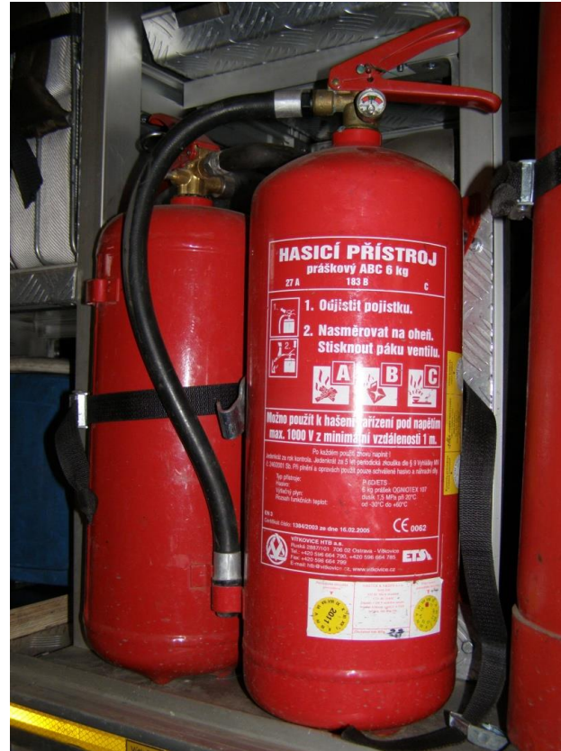
Obr. 11 Hasicí přístroje ve vozidle PS Lidická

https://www.youtube.com/watch?v=QO7KETrafeo (10:10)