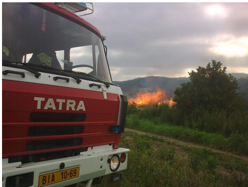
Obr. 6 Vozidlo JSDH Kuřim

Požár definujeme „každé nežádoucí hoření, při kterém došlo k usmrcení nebo zranění osob a zvířat, ke škodám na materiálních hodnotách nebo životním prostředí a nežádoucí hoření, při kterém byly osoby, zvířata, materiální hodnoty nebo životní prostředí bezprostředně ohroženy.“ (SH ČMS, 2008, s. 27)