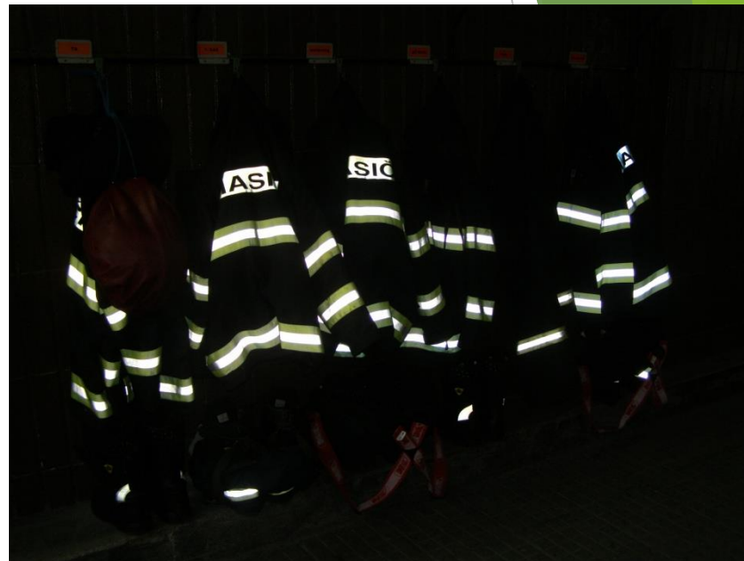
Obr. 10 Zásahové oděvy PS Lidická