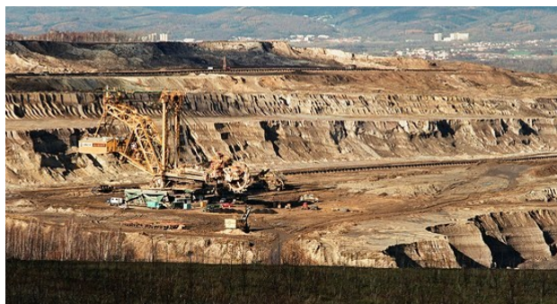
Těžba nerostných surovin

(téma – velehory Alpy a Západní Karpaty)