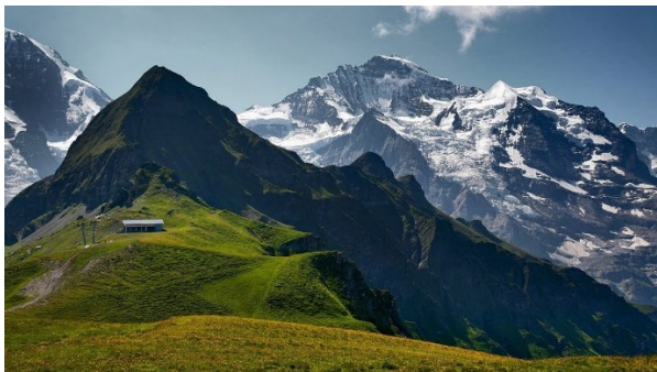
Švýcarsko – Alpy

(téma – velehory Alpy a Západní Karpaty)