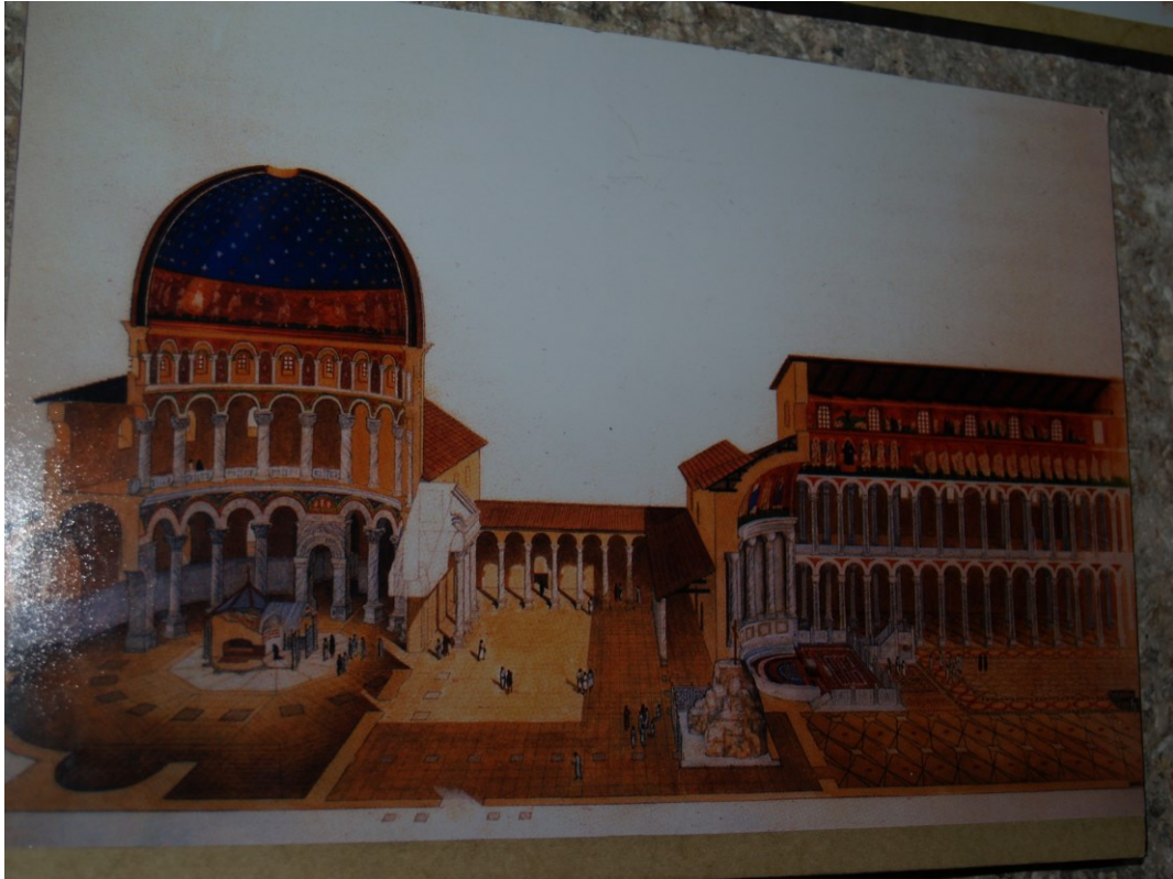
Chrám Božího hrobu v Jeruzaléme. V levé části je vidět Kristův hrob, uprostřed vpravo skála – Golgota – místo ukřižování.