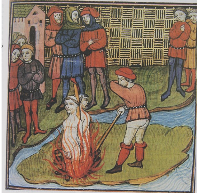
Upálení posledního velmistra templářů J. de Malaye