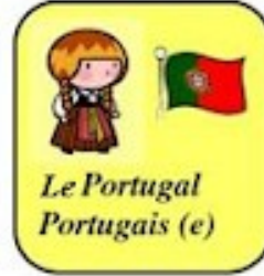
Le Portugal Portugais (e)