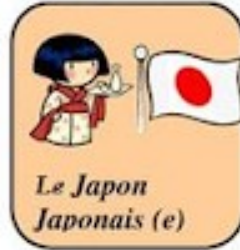
Le Japon Japonais (e)