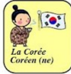
La Corée Coréen (ne)