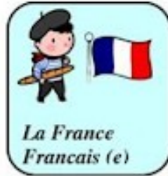
La France Français (e)