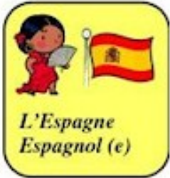
L'Espagne Espagnol (e)