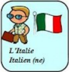
L'Italie Italien (ne)