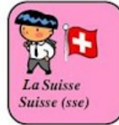
La Suisse Suisse (sse)