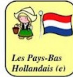
Les Pays-Bas Hollandais (e)