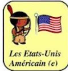
Les Etats-Unis Américain (e)