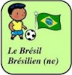
Le Brésil Brésilien (ne)