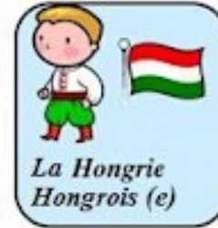
La Hongrie Hongrois (e)