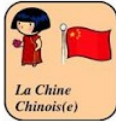
La Chine Chinois(e)