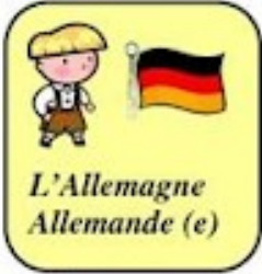
L'Allemagne Allemande (e)