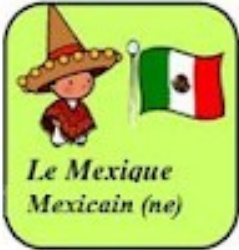
Le Mexique Mexicain (ne)