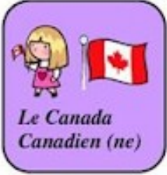
Le Canada Canadien (ne)