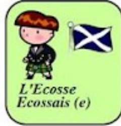
L'Ecosse Ecossais (e)