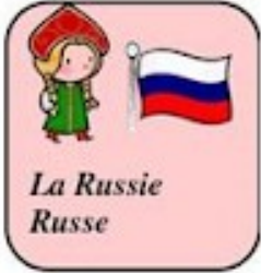
La Russie Russe