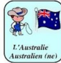
L'Australie Australien (ne)