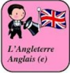
L'Angleterre Anglais (e)