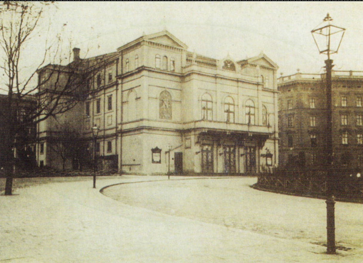
Prozatímní divadlo v Brně