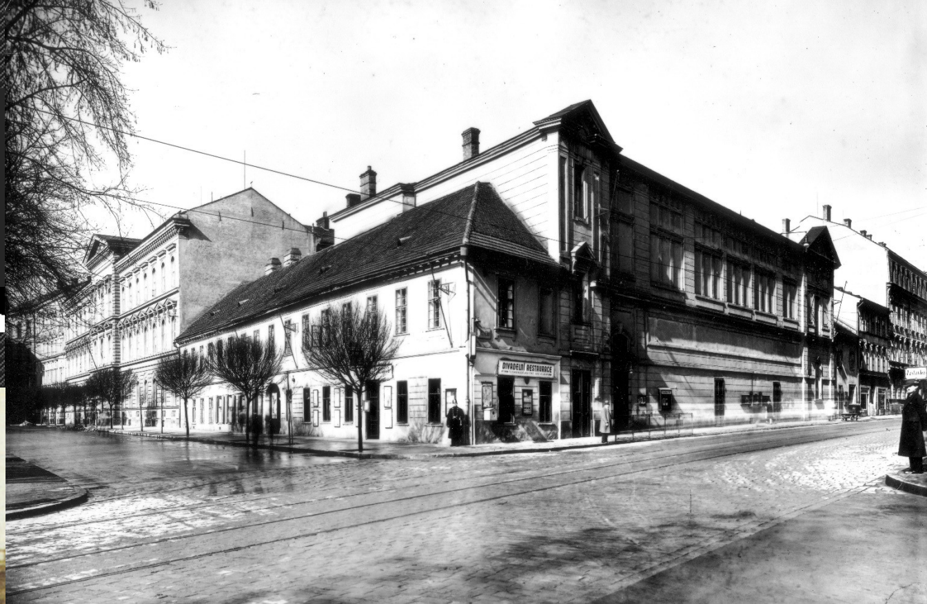
Divadlo na Veverří v Brně, podoba v r. 1934