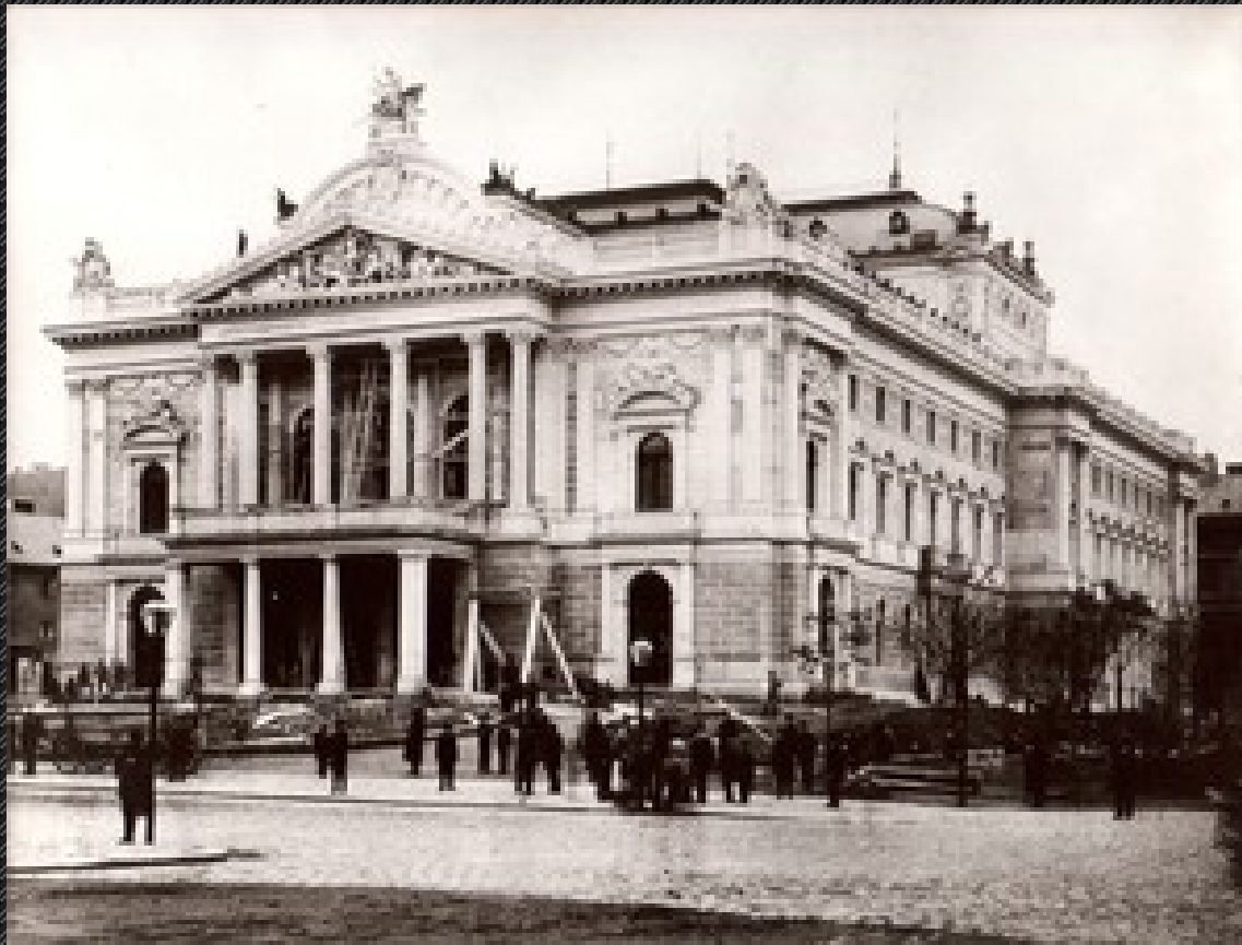
divadlo Na hradbách, 1882