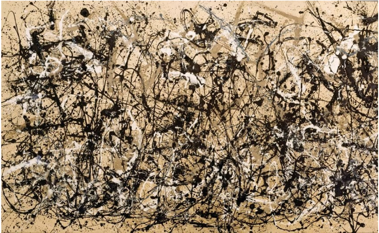
Jackson Pollock, Autumn Rhythm, 1950