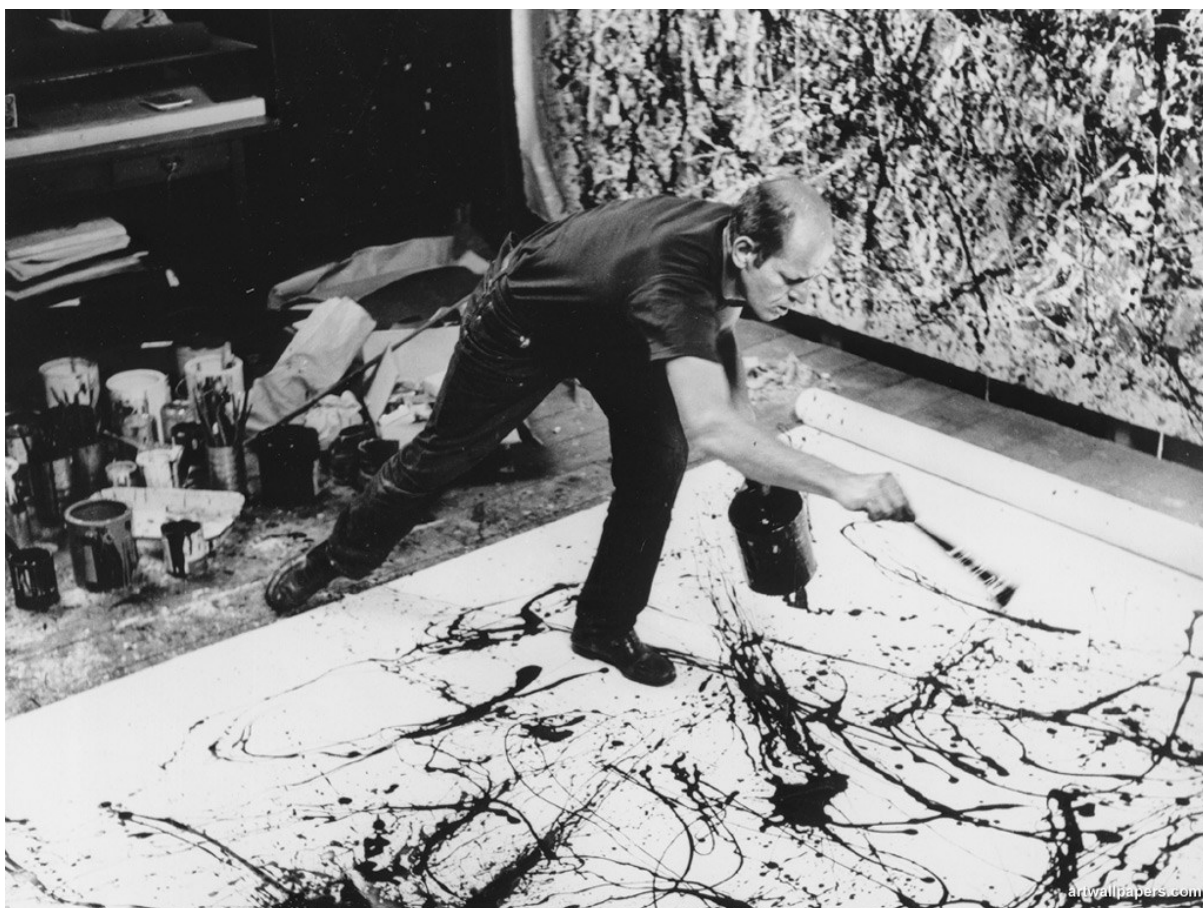
Jackson Pollock při tvorbě