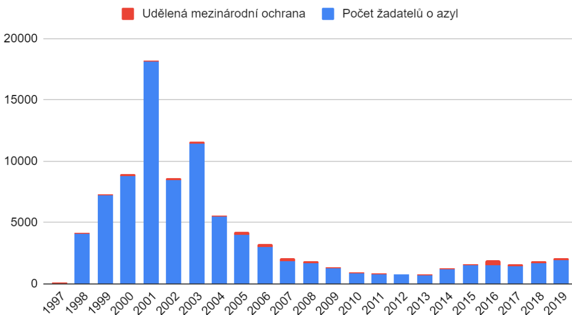
Nejčastější státní příslušnost držitelů mezinárodní ochrany (všech) v ČR