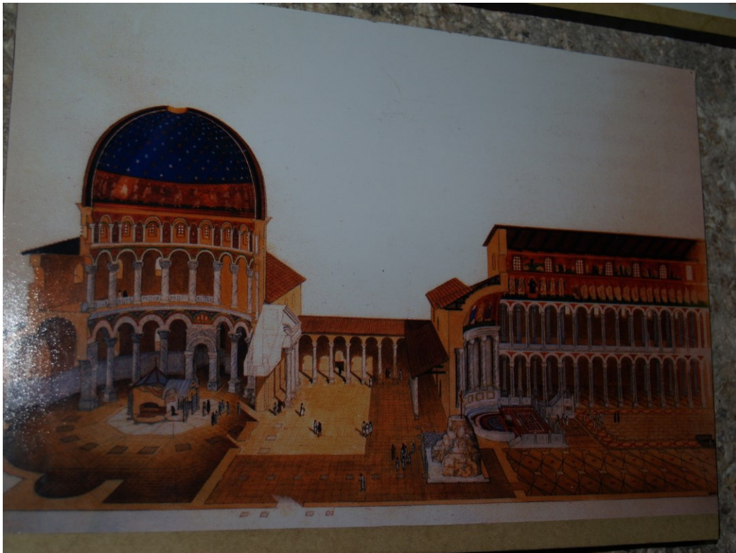
Chrám Božího hrobu v Jeruzaléme. V levé části je vidět Kristův hrob, uprostřed vpravo skála – Golgota – místo ukřižování.