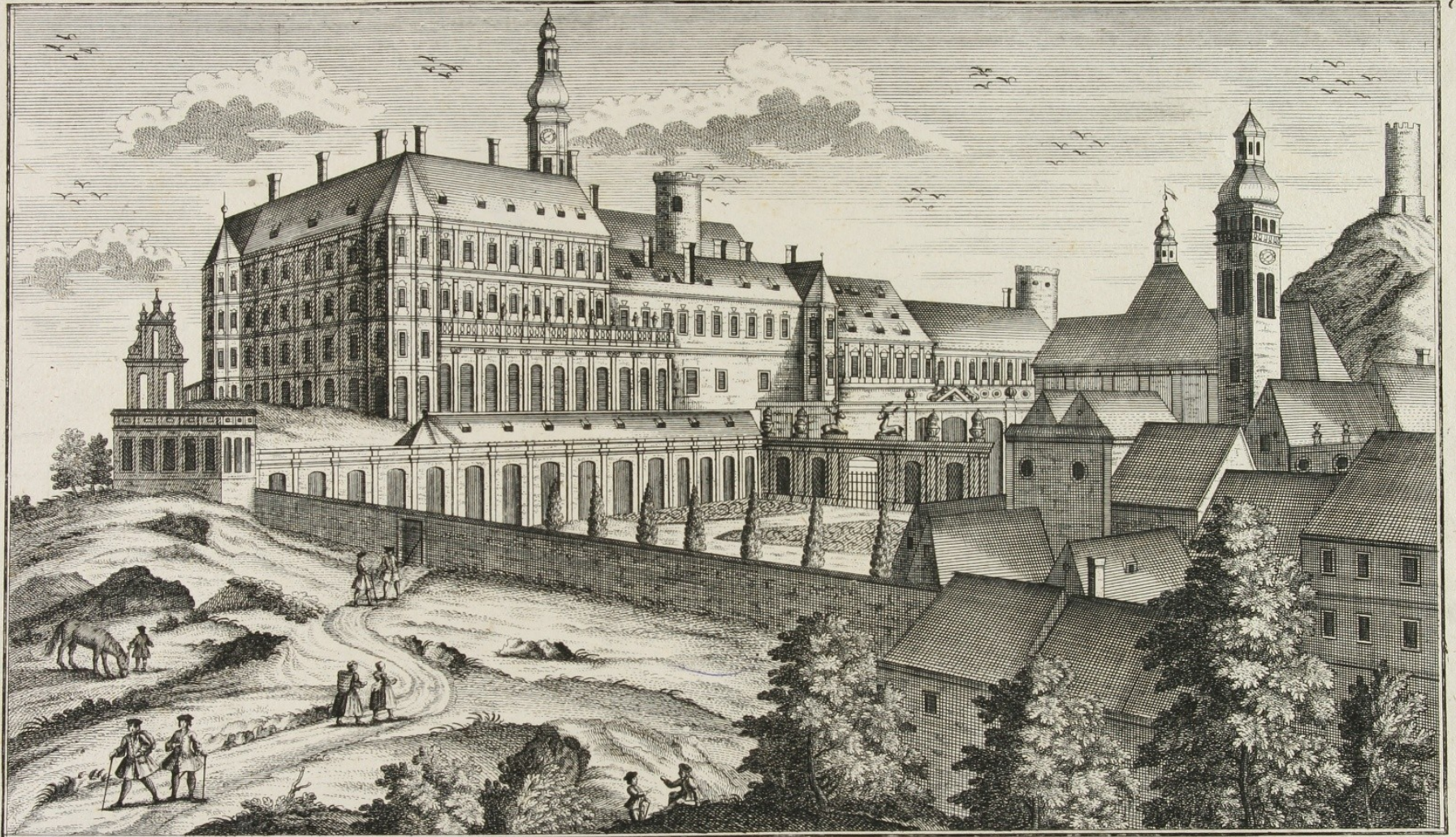
Prospectus arcis et palatii Principis a Dietrichstein Nicolauiburgi.