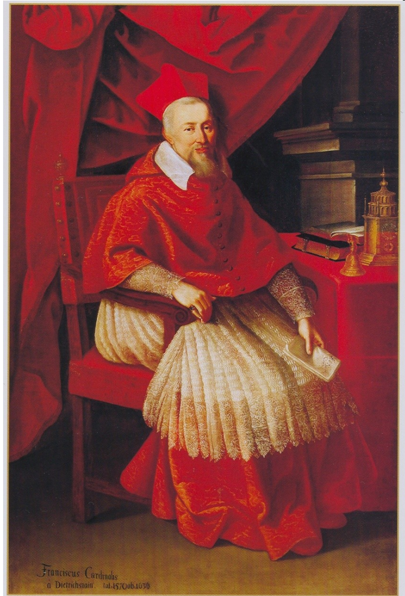
Franciscus Cardinalis à Dietrichstein. tab. 157. Oub. 1676