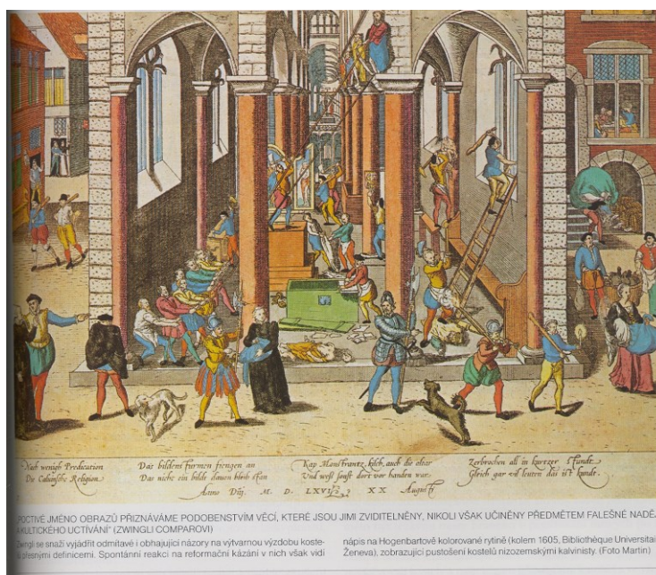
PŮVĚNÉ JMÉNO OBRAZŮ PŘÍZNÁVÁME PODOBENSTVÍM VĚCI, KTERÉ JSOU JIMI ZVIDITELNĚNY, NIKOLI VŠAK UČINĚNY PŘEDMĚTEM FALEŠNÉ NADĚJE KULTURNÍHO UČTIVÁNÍ (ZWINGLI COMPARATI) nápěje na Hogenbartově kolorované rytině (kolem 1605, Bibliothèque Universitaire Ženeva), zobrazující pustošení kostelů nizozemskými kalvinisty.

1565 se připojila i nižší šlechta k opozici a byl uzavřen tzv. kompromis bredský (město Breda) – žádali zrušení inkvizice a uzákonění reformace, 5. dubna požadavky odevzdány Markétě. Než Madrid zaujal stanovisko, došlo k lidovému povstání proti nadvládě a katolické církvi – ničení kostelů a vnitřního zařízení – obrazoborectví , poničeno více než 5500 kostelů.