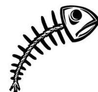
ohlodaná (okousaná) rybí