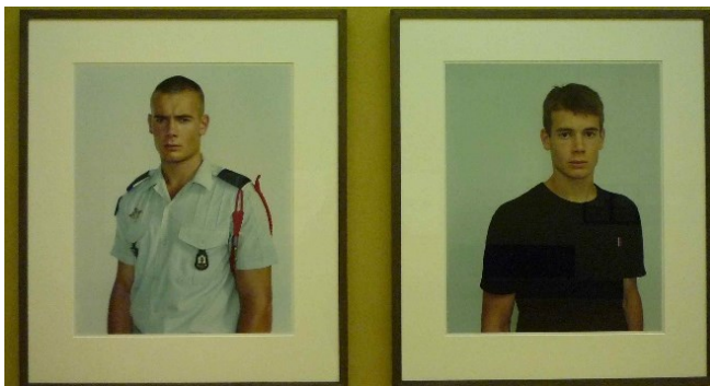
Rineke Dijkstra (2003)