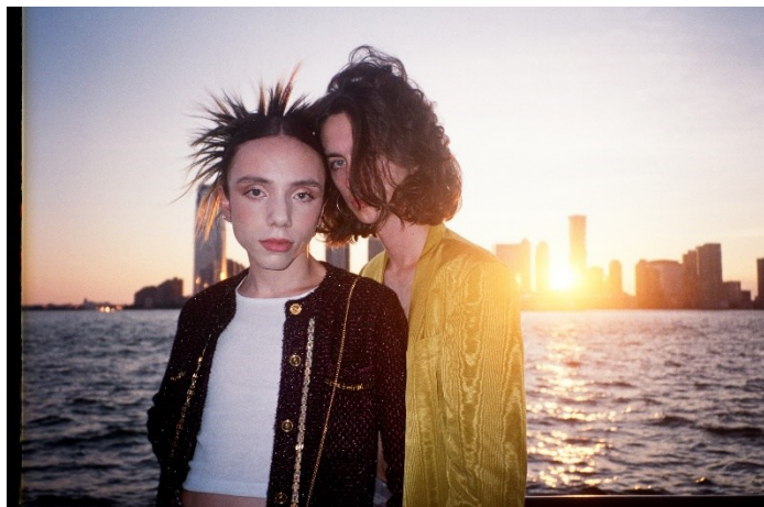
New York New York

„Tam to ale nestálo za nic, takže jsem ztratila veškerý elán a po škole vůbec nevěděla, co se sebou. Nikdy předtím jsem neměla sen odjet do Ameriky, ale po promoci jsem si řekla, že to zkusím...“ (Hospodářské noviny 5. 5. 2019)