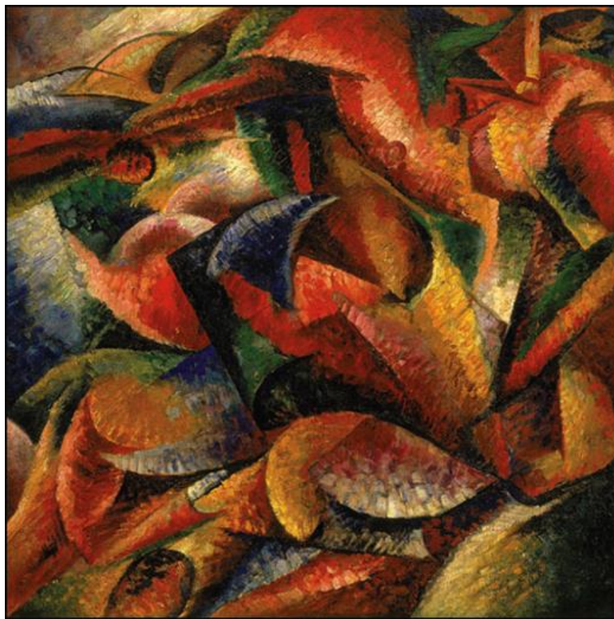
Dynamismus lidského těla, 1913