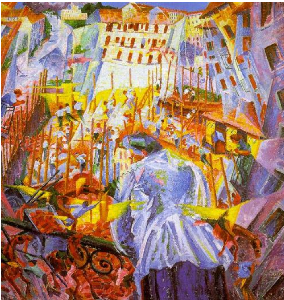
Hluk ulice proniká do domu, 1911