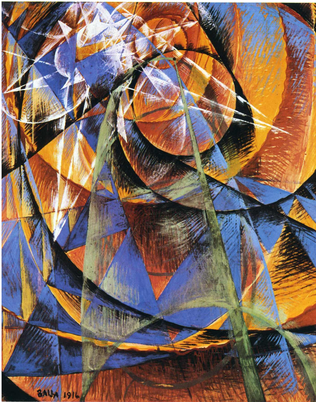
Merkur míjející slunce, 1914