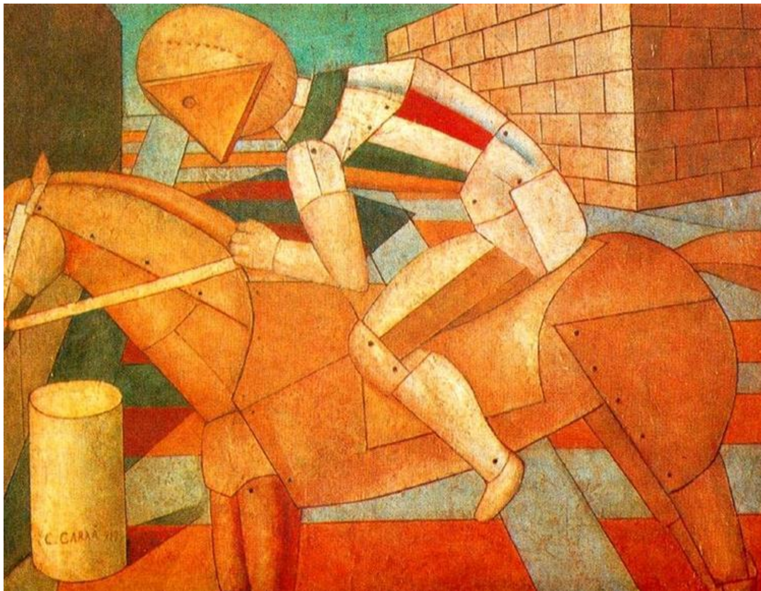
Západní jezdec, 1917