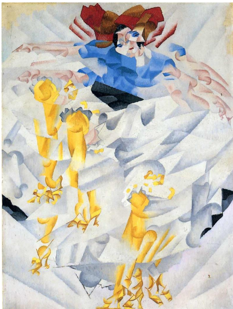
Dynamismus tanrčnice, 1912