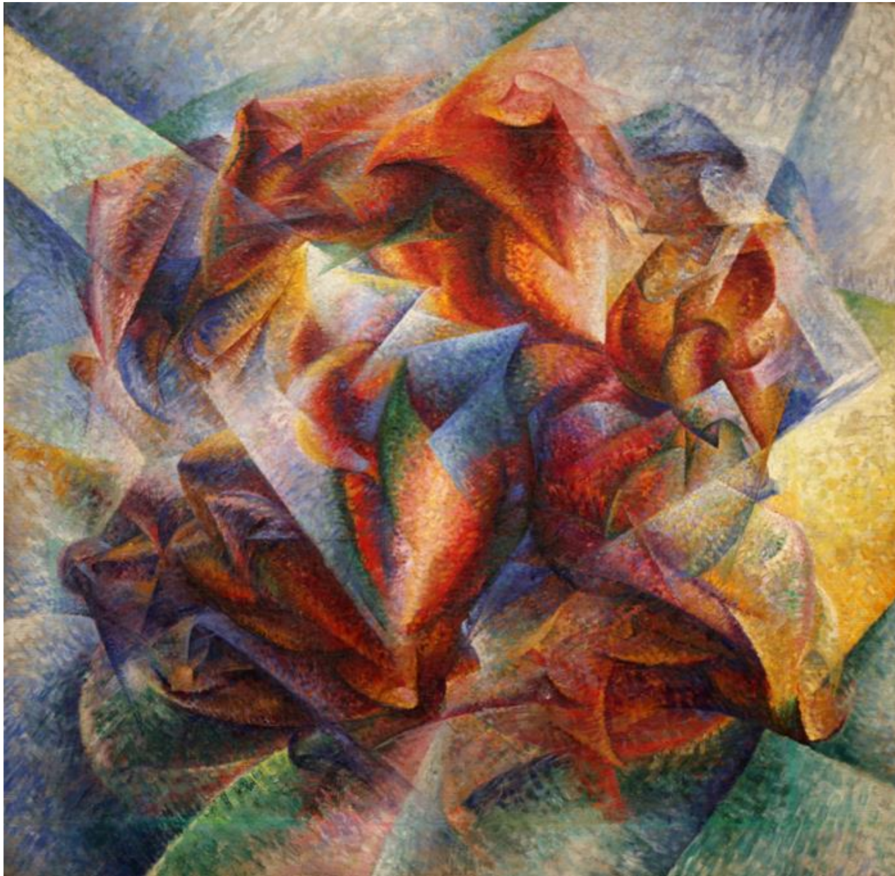
*Dynamika fotbalisty, 1913