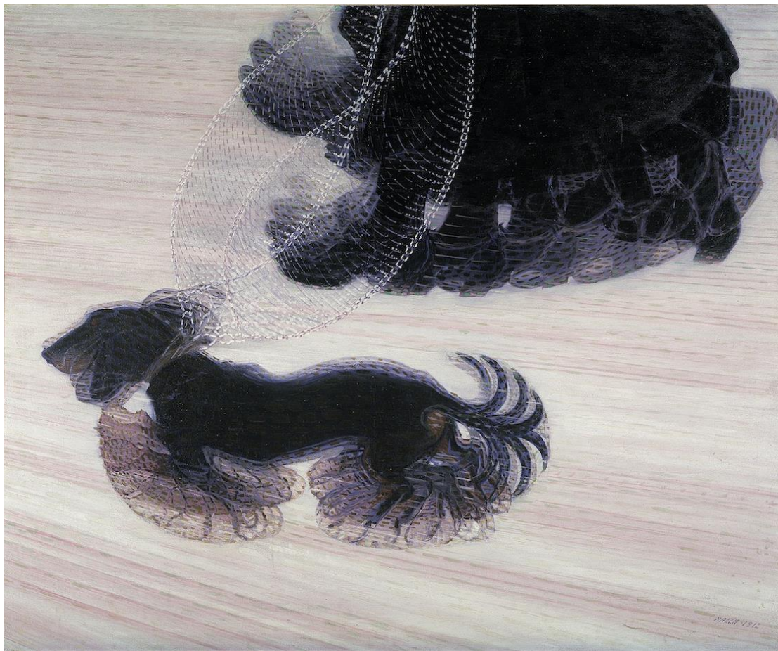
Dynamičnost psa na vodítku, 1912