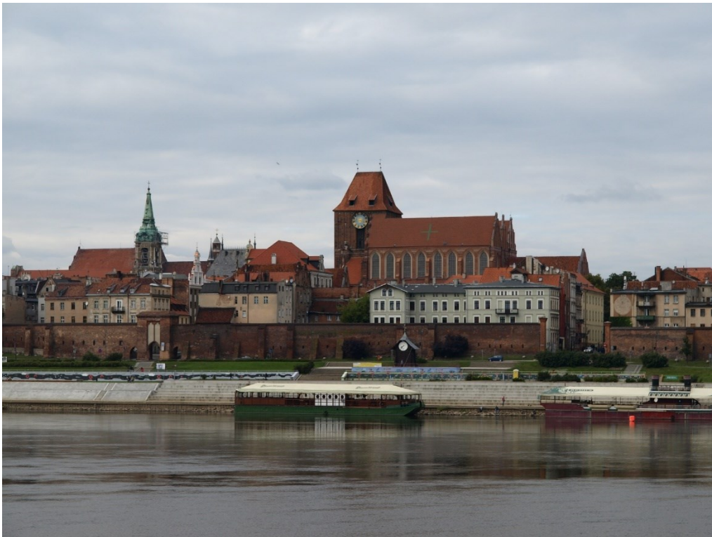
Toruň – THORN.

K nejpříkladnějším dílům renesanční urbanistiky náleží Zamošč . (dnes UNESCO