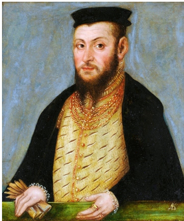
Zikmund II. August