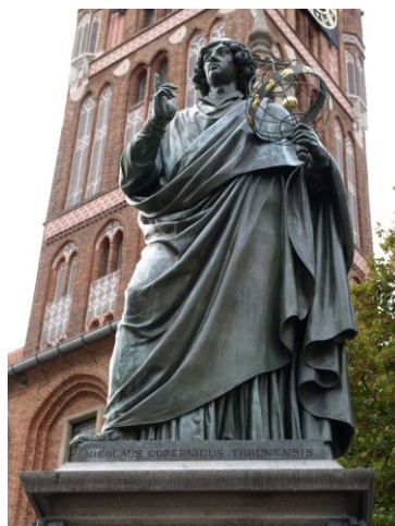
Toruň – socha a rodný dům Mikuláše Koperníka