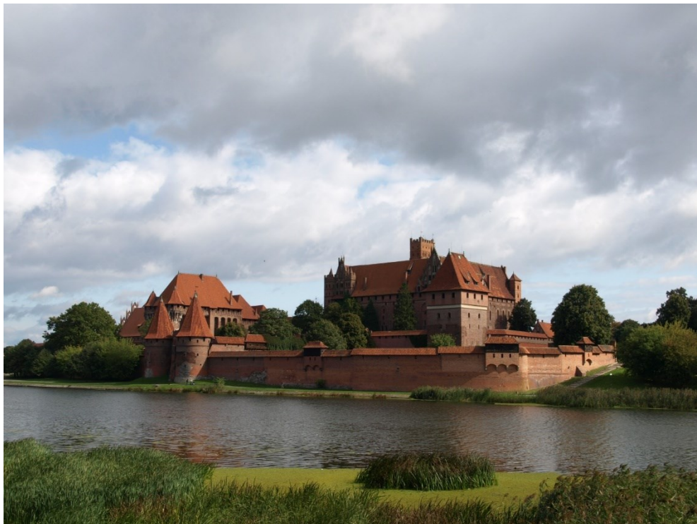
Marienburg – Malbork – největší hrad střední Evropy