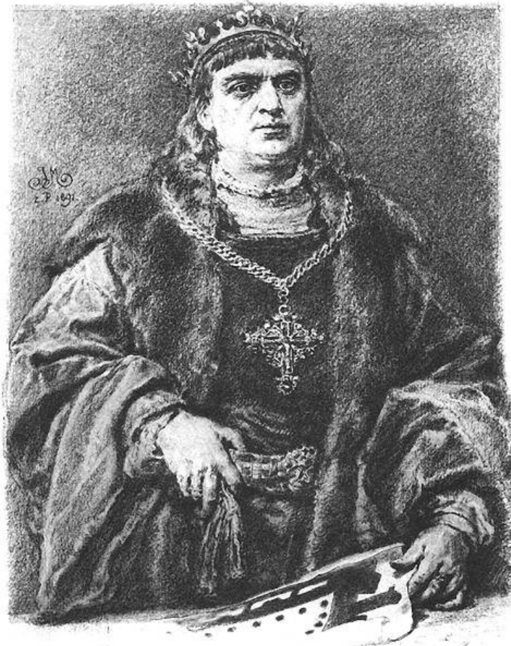
Zikmund I. Starý (Jan Matejko)