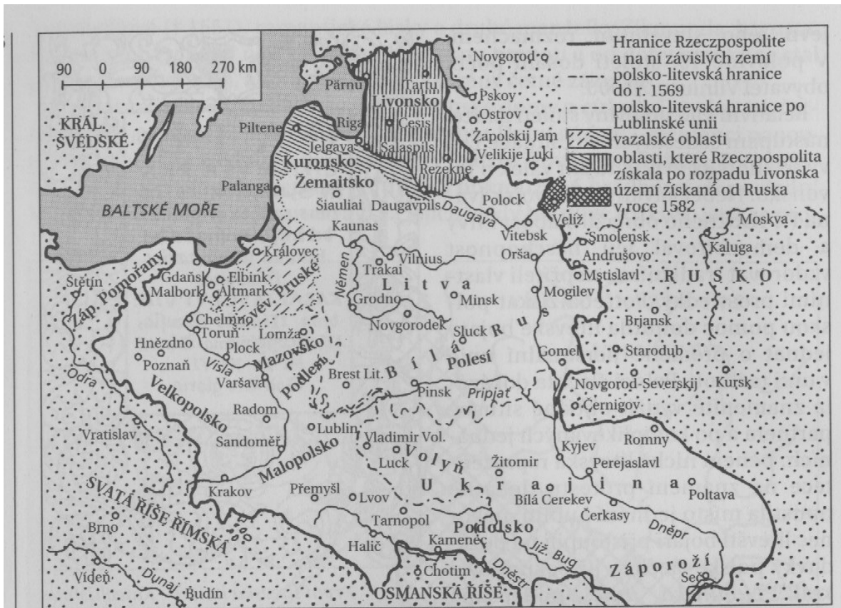
Polsko-litevský stát ve druhé polovině 16. století