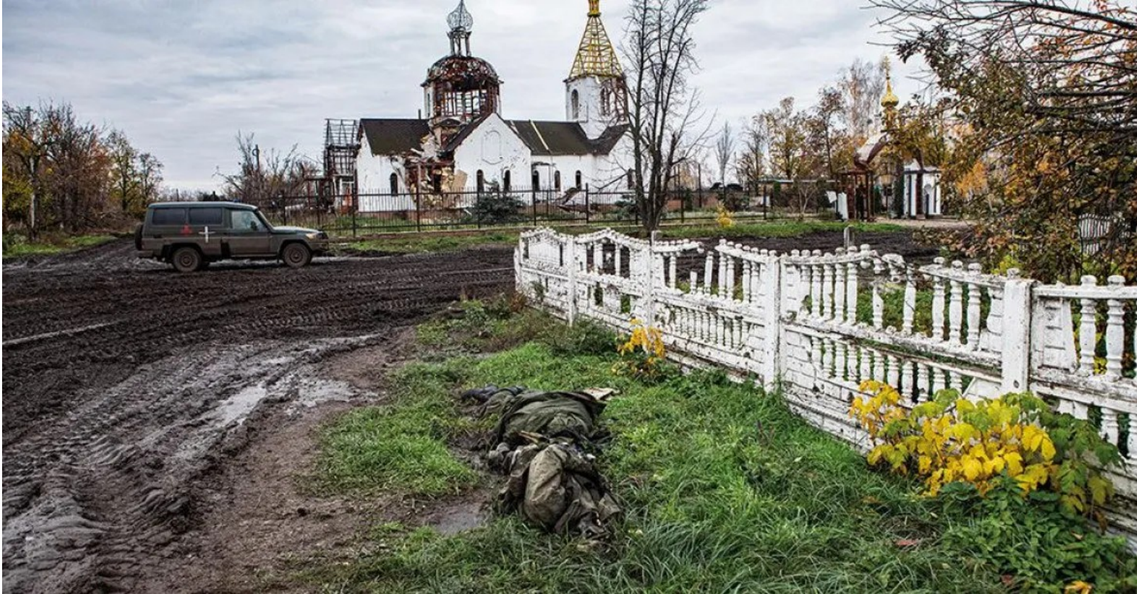
Aktuální obrázek z rusko-ukrajinské války: tělo vojáka a v pozadí zničený kostel