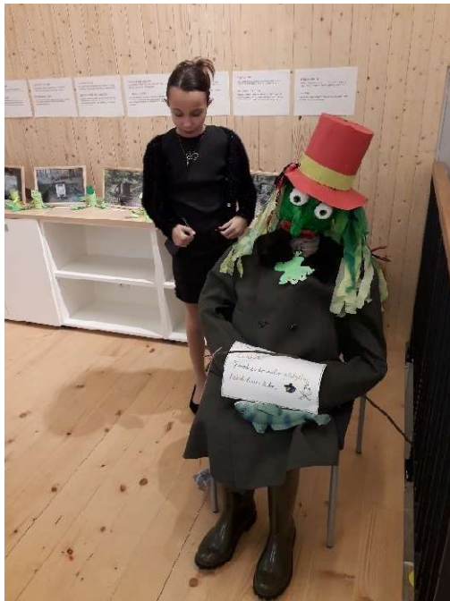
Zdroj: foto vlastní (2023)