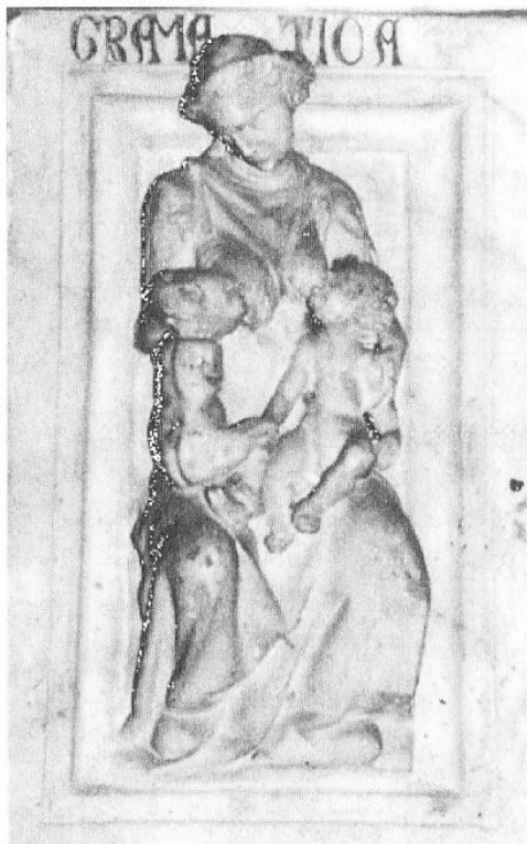
Abb. 1-4: Frau Grammatica als Nährende (Pisa, Kanzelfuß, um 1302-11)

Dass man diesem didaktischen Anspruch oft nicht gerecht wird bzw. Schule im Allgemeinen und Grammatikunterricht im Besonderen als Tortur gilt, wo der Lehrer uneingeschränkt regiert, macht Erasmus von Rotterdam in seinem Lob der Torheit (1508) deutlich: