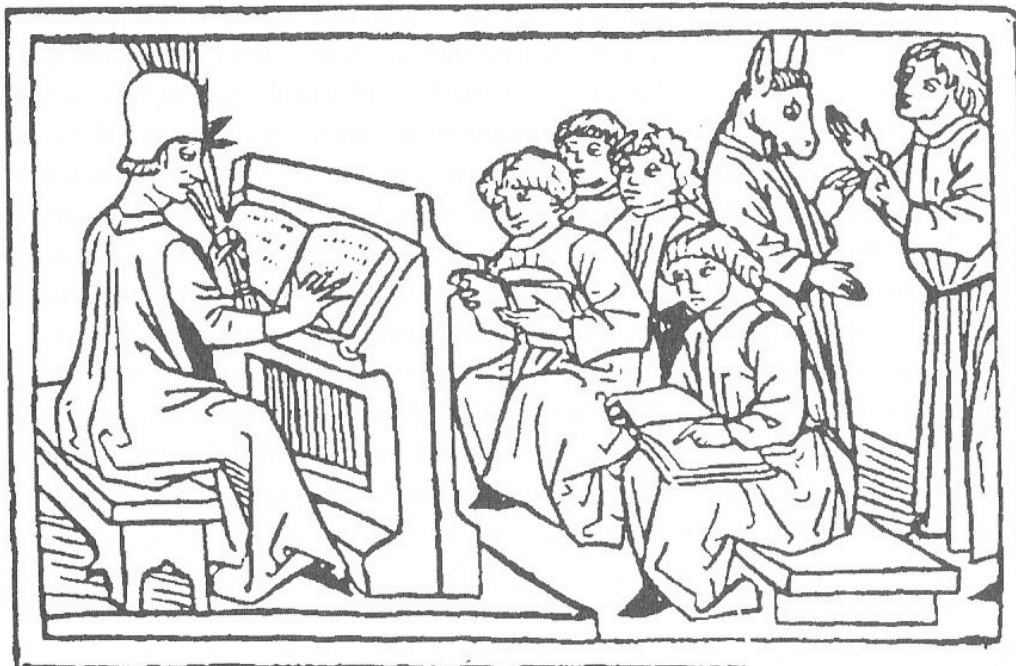
Abb. 1-5: Der strenge Magister (Holzschnitt aus Rodericus Zemorensis, Augsburg, um 1479)

Auch wenn sich Sprachunterricht heute anders gestaltet als im 16. Jahrhundert, so bleibt immer noch die Einschätzung bestehen, dass Grammatik arbeitsaufwendig, kompliziert und nervenaufreibend ist und oft zum ‚Exerzierplatz‘ von Strukturwissen wird, das für die Lernenden relativ bedeutungslos bleibt. Gleichzeitig ist Grammatik aber erforderlich – und das nicht nur, um Prüfungen zu bestehen. Ihre Bedeutsamkeit ergibt sich vielmehr aus ihrer Schlüsselrolle, zwischen den Strukturen einer Sprache und ihrer Anwendung zu vermitteln 4 und damit Wege aufzuzeigen, wie das ‚Zauberwort‘ immer wieder, und auch gerade in der Fremdsprache, gefunden werden kann.