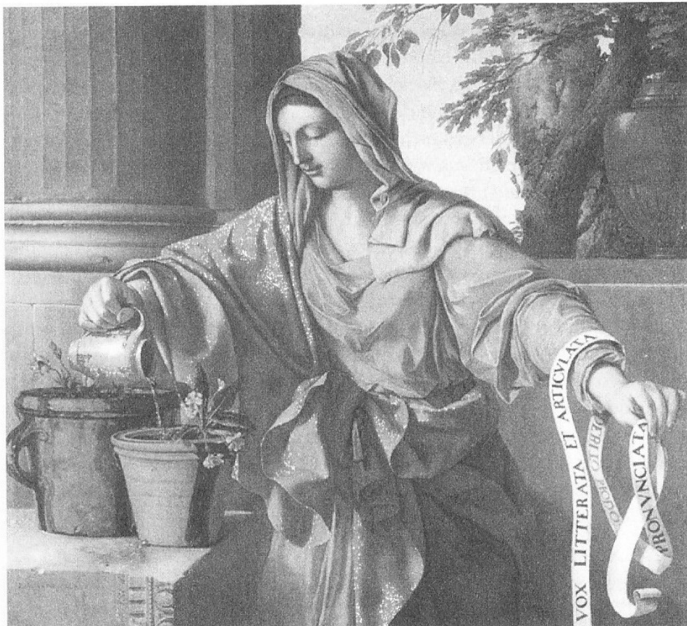
Abb. 1–1: Allegorical Figure of Grammar, 1650 (Laurent de La Hyre, National Gallery, London)

Das strenge Regelsystem der ‚Grammatiker‘ engt hier das Wachstum von Sprache entlang der menschlichen Empfindungen ein; Sprache herrscht , anstatt im Dienst des Menschen zu stehen, der zu der fremdsprachlichen Welt eine Beziehung sucht. Wie anders ist dagegen die Darstellung der Frau Grammatika in dem Gemälde von Laurent de La Hyre, wo sie als Frauengestalt sorgend die etwas kümmerlichen Pflänzchen des sprachlichen Ausdrucks bewässert: