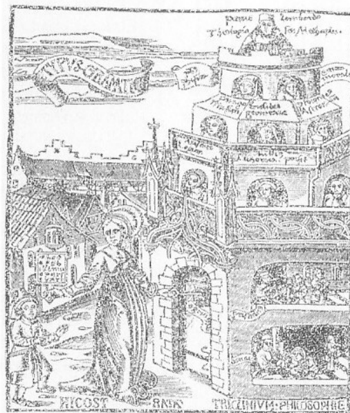
Abb. 1–3: Grammatica mit Schlüssel zum Grammatikturm (Freiburg i. B., um 1503)

Gleichzeitig zieht sich aber auch das Motiv des rechthaberischen Grammatikers von Antiphanes (s. o.) durch die Jahrhunderte. Im Bild des strafenden Magisters der Schulstube (Abb. 1–5) zeichnen sich die verändernden Lehr- und Lernbedingungen der Neuzeit ab: Anstatt dass Wissen und Erkenntnis wenigen Privilegierten vorbehalten sind (die sowieso lernen wollen), ist nun Bildung den meisten Mitgliedern der Gesellschaft zugänglich. Diese Demokratisierung des Lernens hat aber auch eine Verpflichtung zum Lernen (oder zumindest zum Schulbesuch) zur Folge 3 . In der Neuzeit entwickelt sich daher die Herausforderung an Lehrende, Bildungsgüter ansprechend und effizient zu vermitteln.