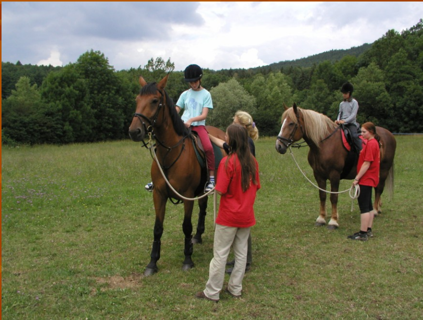
■ Obrázek: o.s. Svítání