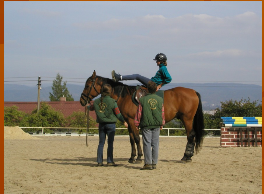
■ Obrázek: o.s. Svítání