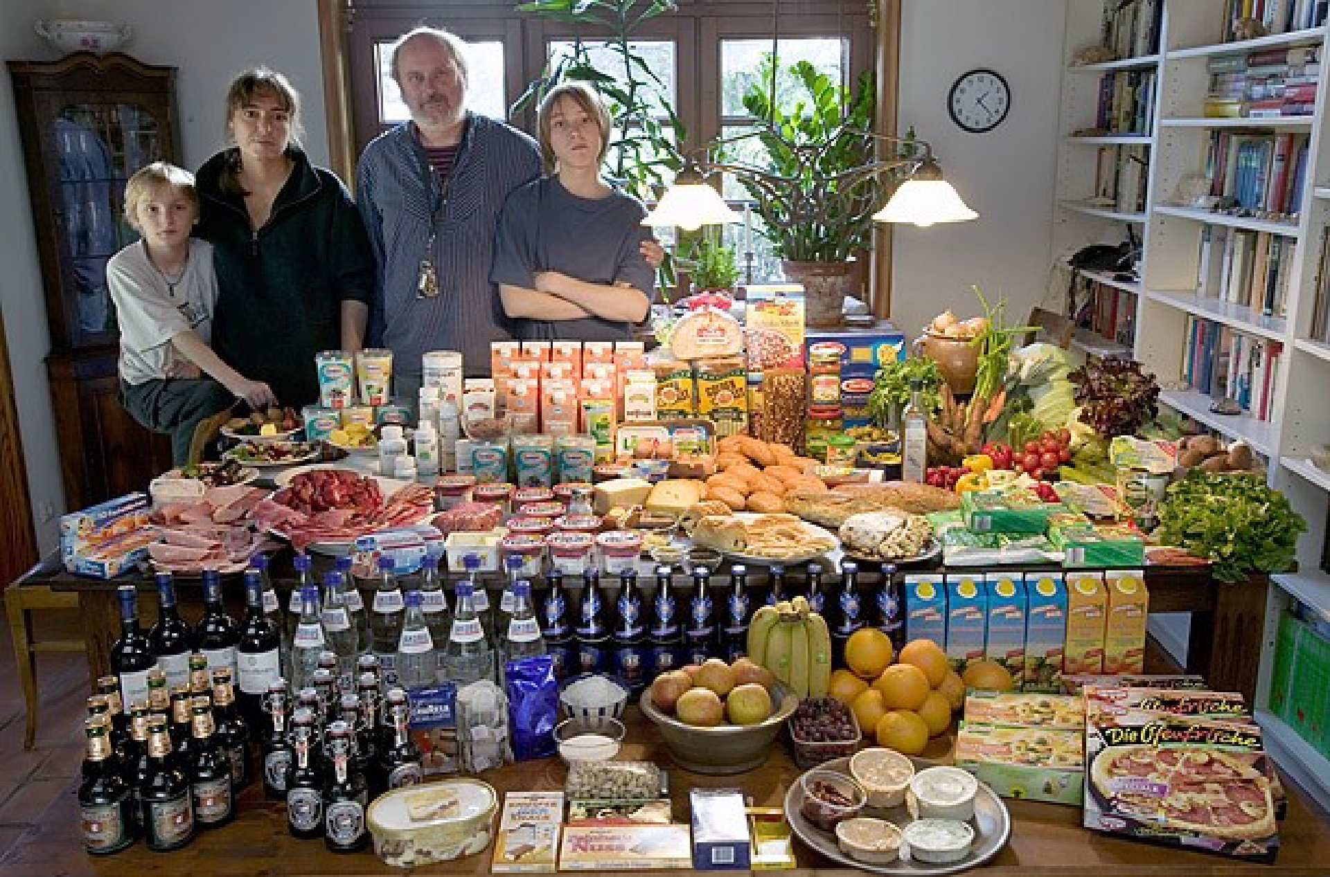
DEUTSCHLAND : $500 / týždeň