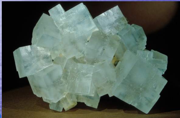
Halit = Sůl kamenná