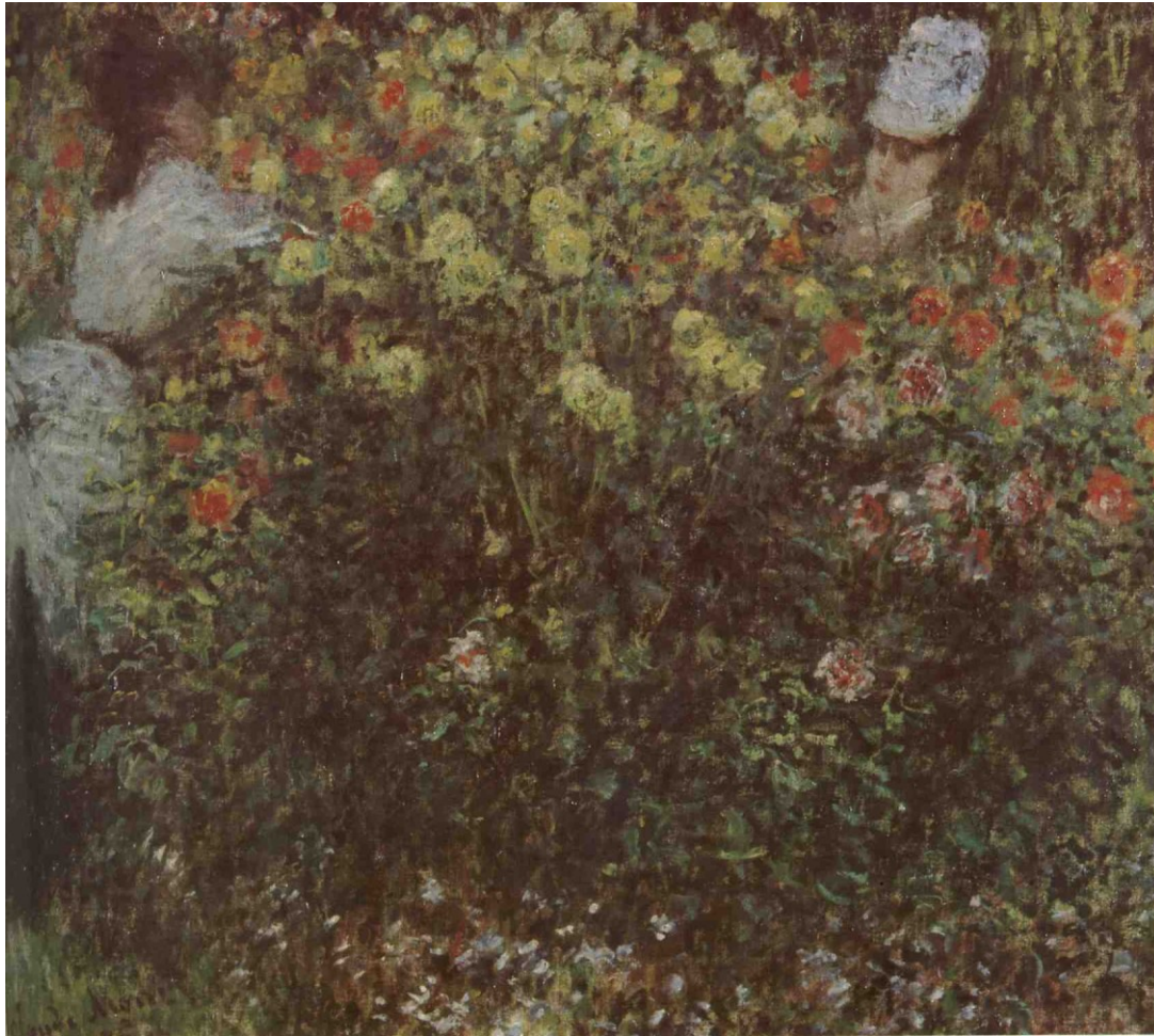
Claude Monet, Dámy v květinách (1875), Veletržní palác Národní galerie, Praha