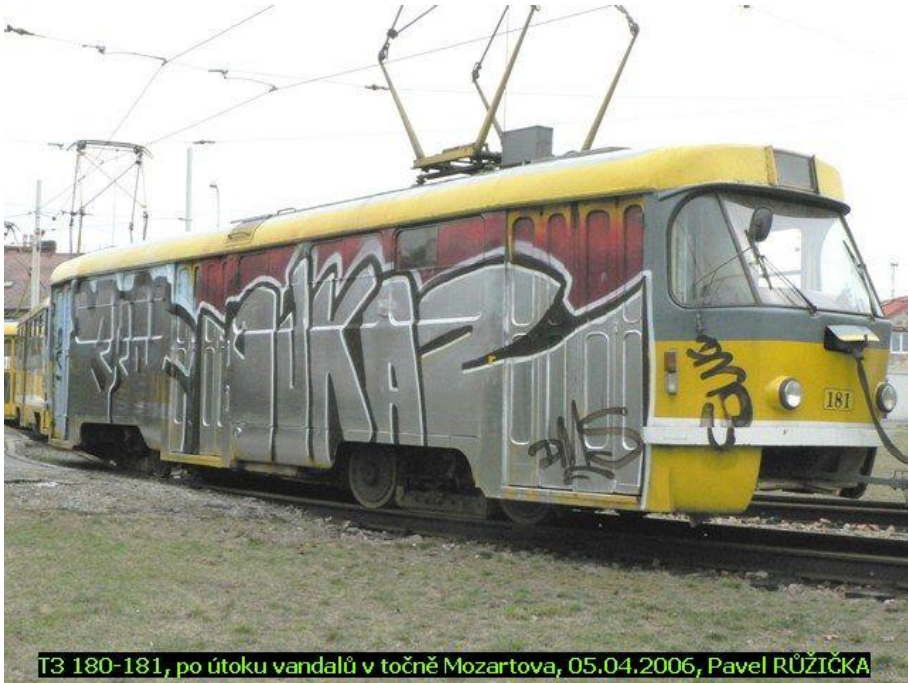
T3 180-181, po útoku vandalů v točně Mozartova, 05.04.2006