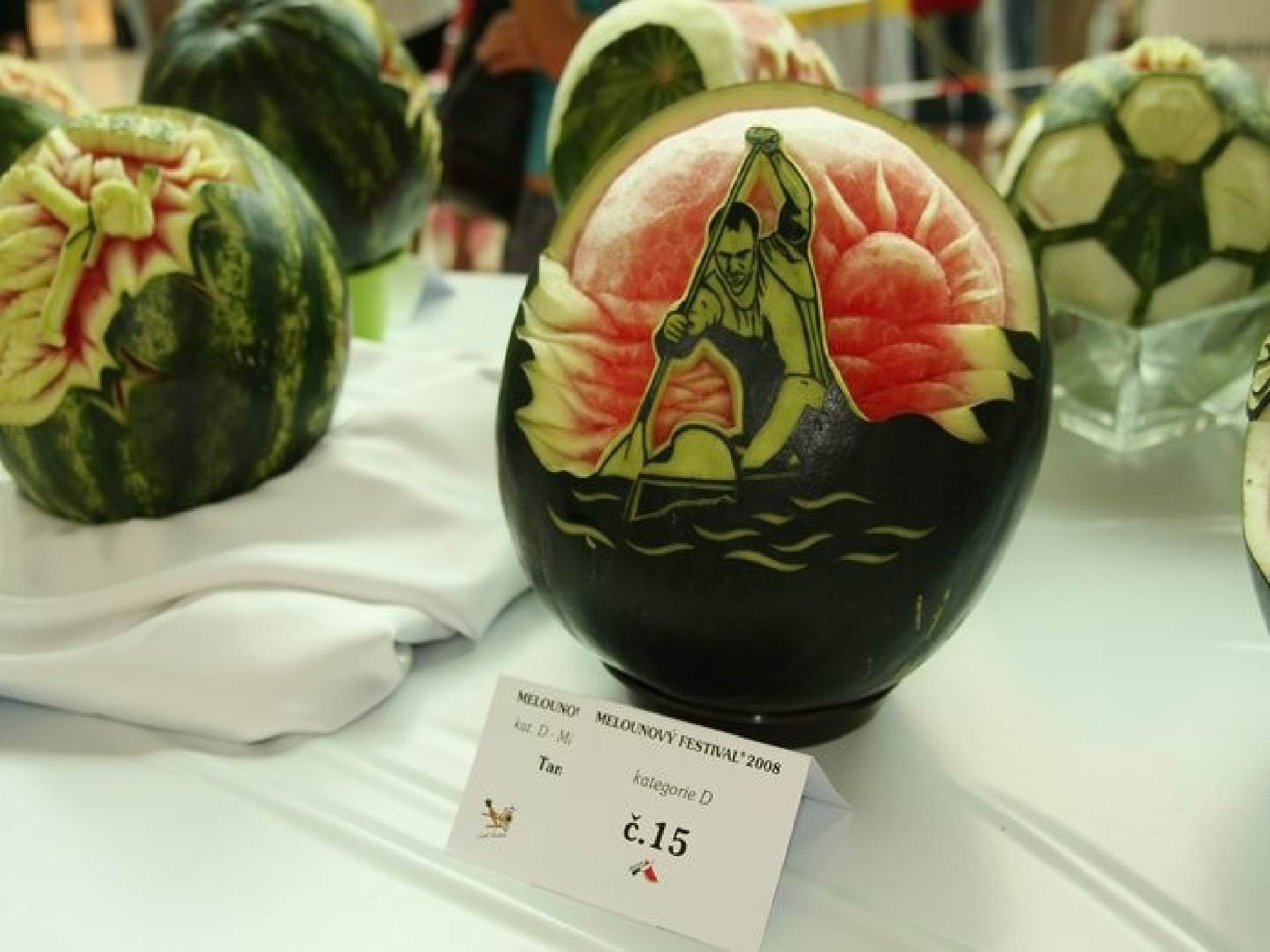
MELOUNOVI kat. D - M Tan MELOUNOVÝ FESTIVAL 2008 kategorie D č. 15