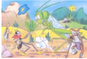
Obr. 6: Ferda Mravenec, koník a brouk (Pytlík)

Ferda Mravenec má .. (1), tj. .. (2) páry končetin. Mravenec jako hmyz má .. (3), tj. .. (4) páry nohou. Vyrůstají z ..... (5), tj. správně – špatně (6 - správně podtrhni, nebo špatně škrtni). Cvrček, ploštica a brouk (Pytlík) mají zadní končetiny – nohy umístěny správně – špatně (7 - správně podtrhni, nebo špatně škrtni).