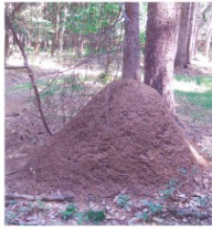
Obr. 1: Mraveniště v lese

Odborně to jsou velcí lesní ..... rodu Formica (dělnice do 9 mm). Staví si nápadná kupovitá hnízda z různého lesního materiálu, z nichž nejuživanější je jehličí. Jejich nejznámějším představitelem je ..... (viz logo). Jsou lesy s vysokým množstvím živých mravenišť a známe jiné, kde je mravenců nedostatek.