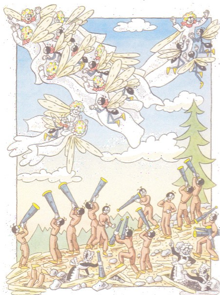
Obr. 11: Ukázka rojení mravenců a polymorfních kast

K tomu, abychom mravencům porozuměli my i naši žáci a studenti, není třeba pouze odborných zdrojů, ale lze využít i formu různých žánrů beletrie s antropomorfizací popsaných organismů založenou na skutečných vlastnostech. V předešlém návodu jsme předložili ukázkou, kolik odborných poznatků lze získat.