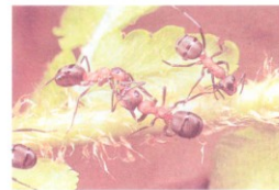
Obr. 4: Dotyková komunikace mravenců r. Formica

Některé druhy mravenců jsou býložravé (žijí se semeny), jiné se živí mršinami, všežravě a známe i dravé formy. Někteří dokonce pěstují v mraveništi houby (jihoamerický rod Atta ), nebo využívají jako zdroj potravy medovici, tj. sladkou tekutinu z mšic. Tyto dokonce ochraňují. Vztah mravenců a mšic je výhodný pro obě strany a lze ho označit jako proto kooperaci (předchůdce symbiózy). Díky své dravosti loví jiné hmyzí druhy, které mohou žírem poškozovat stromy (housesky, housenice aj.).