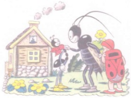
Obr. 5: Ferda Mravenec, cvrček a ruměnice (v knize ploštica Růměnice)

Všichni dospělí hmyzu mají primárně 3 páry kráčívkých končetin. Tyto vyrůstají z hrudních článků. Dokladuj na následujících obrázcích nepřesnosti u různých zástupců hmyzu a u mravenců samotných.