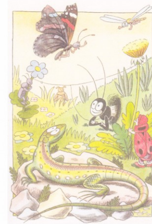
Obr. 9: Sousedí Ferdy Mravenec v dočasném obydlí na mezi

Proti zjednodušení končetin hmyzu je velmi názorné vyobrazení stonožky – každý článek nese 1 pár kráčívkých končetin . Pamatuj! Na rozdíl od mnohožky!