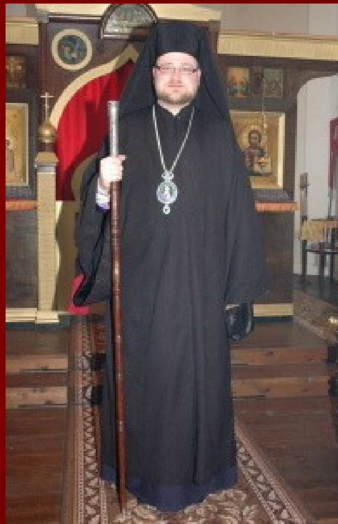
Stavovský oděv: rjasa, mnišský klobouk, v ruce, na prsou má zavěšenu panagii