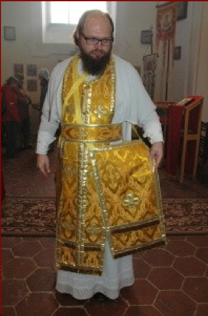
Kněz v bílém sticharu, na něm epitrachil a pás, ukazuje nábedník