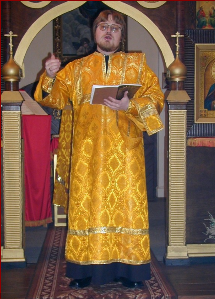
Jáhen ve sticharu s orárem a nárukavníky