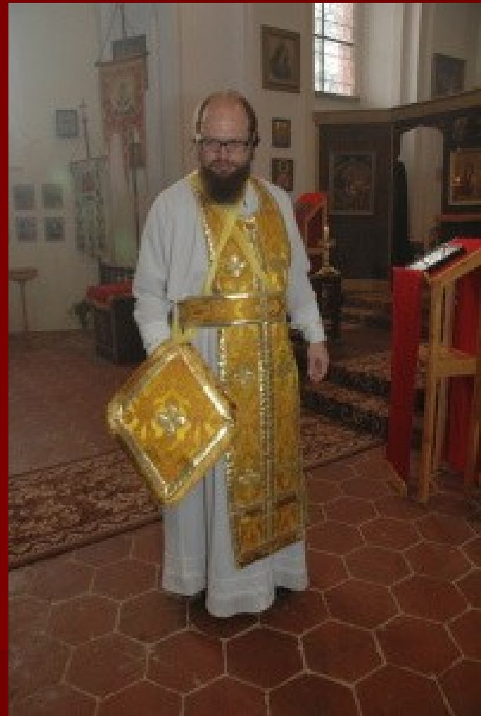
Kněz v bílém sticharu, na něm má epitrachil a pás, ukazuje epigonation