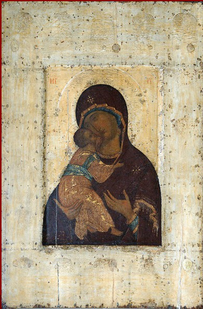
Přesvatá Bohorodička Vladimírská