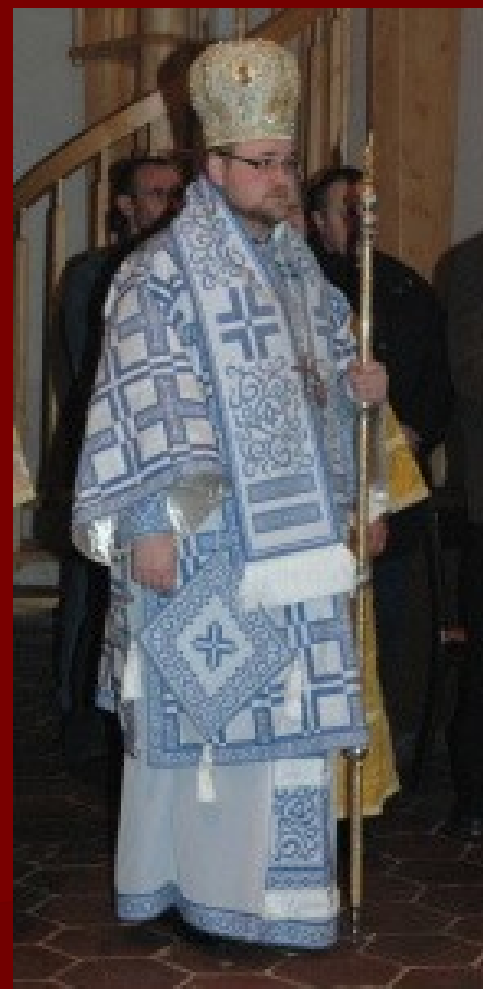
Biskup má stichar, epitrachil, pás, epigonation, nárukávníky, sakos, omofor