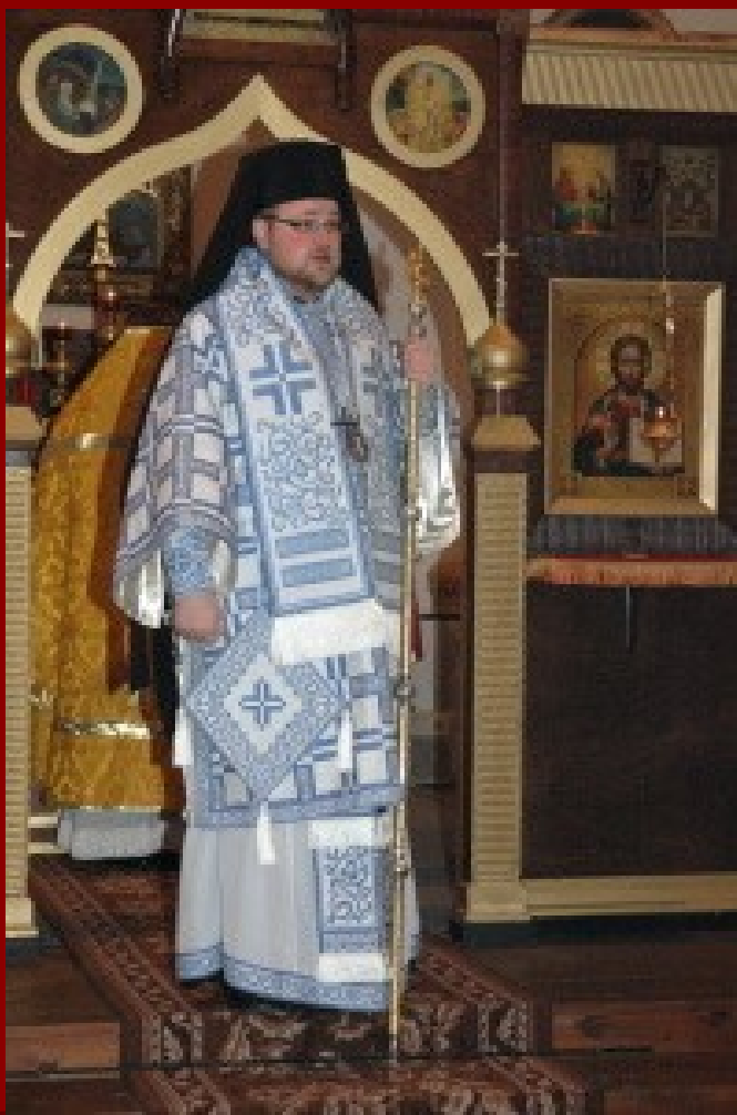
Arcibiskup s mnišským kloboukem