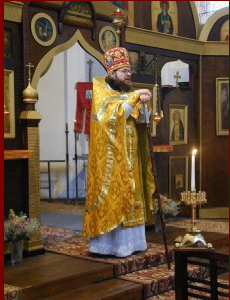
Kněz nosí stichar, epitrachil, pás, nárukavníky