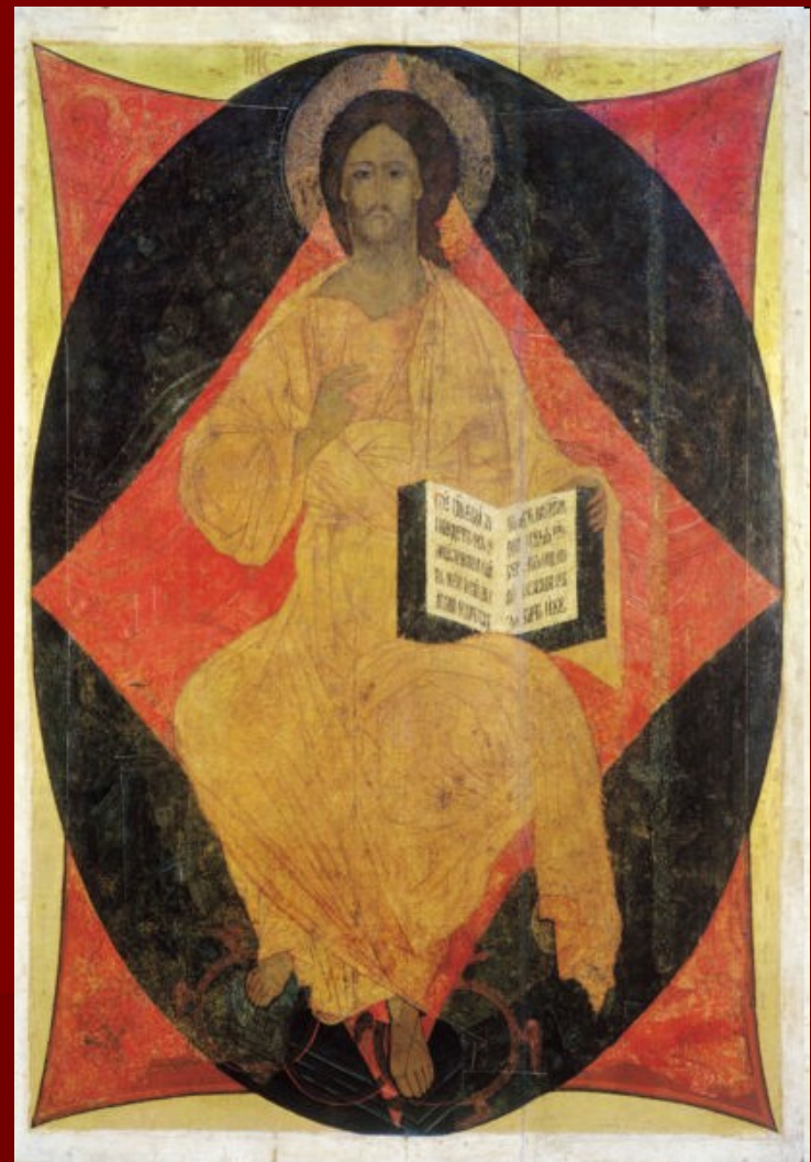
Kristus Pantokrátor Chrám Zesnutí Bohorodičky