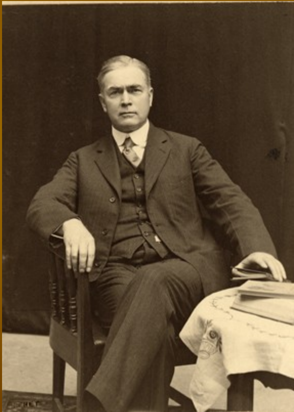
John R. Mott

Misijními konference v Edinburgu v roce 1910