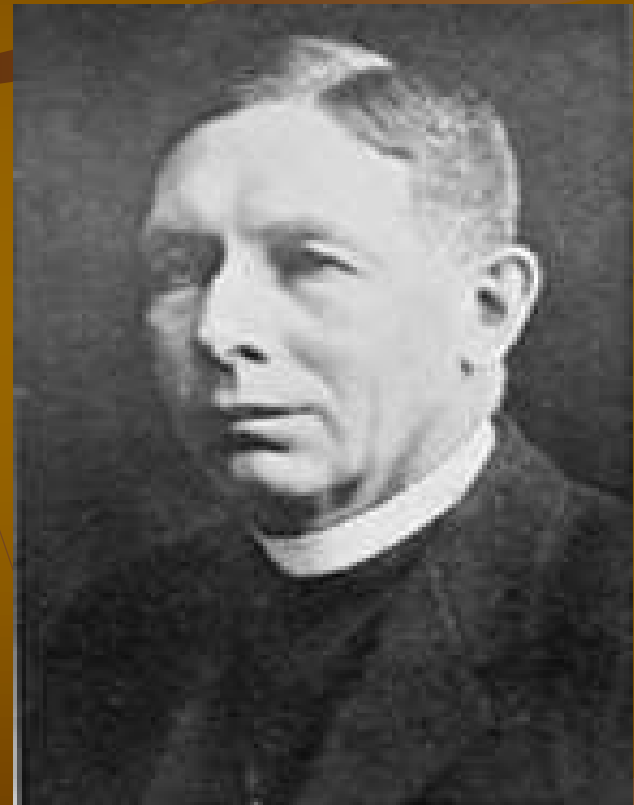
Charles Henry Brent

Počátek hnutí na Světové konferenci Víra a Řád v Lausanne 3.8. 1927, které se účastnilo 439 účastníků s hlasovacím právem.