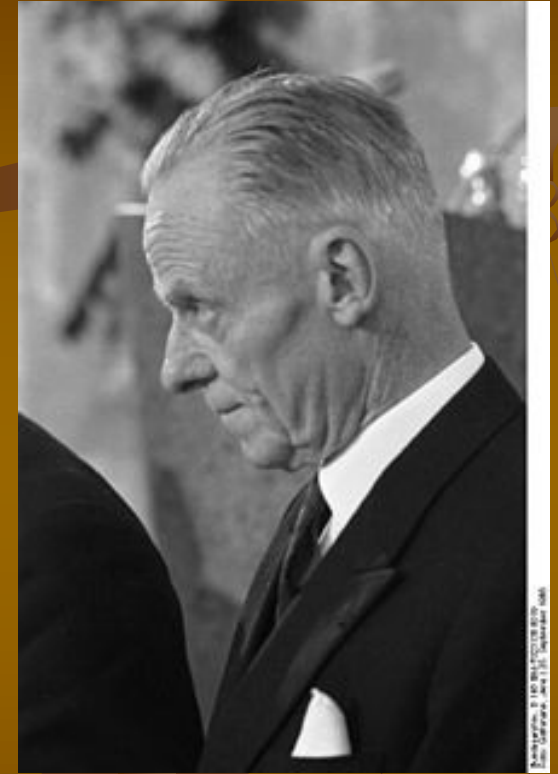
Willem Visser 't Hooft

"Světová rada církví je společenství církví, které vyznávají Pána Ježíše Krista jako Boha a Spasitele podle Písem, a proto společně usilují splnit své povolení pro slávu jediného Boha, Otce, Syna a Ducha svatého."