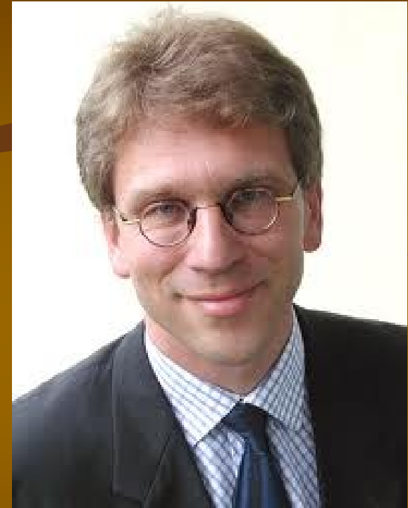
Olav Fykse Tveit

Světová rada církví (SRC), anglicky World Council of Churches (WCC), byla založena 23. srpna 1948 na svém prvním Valném shromáždění v Amsterdamu. V současné době sdružuje 349 církví z více než 110 států světa. Je tak společenstvím pro více než 560 milionů lidí, kteří se hlásí k anglikánské, protestantské, pravoslavné a starokatolické tradici. Zatímco většina zakládajících církví WCC je bylo evropské a severoamerické, dnes většina členských církví, jsou v Africe, Asii, Karibiku, Latinské Americe, na Středním východě a v Tichomoří.